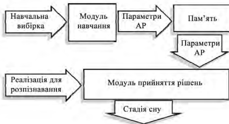
Рис. 1. Структура системи автоматизованого розпізнавання стадій сну за ЕЕГ