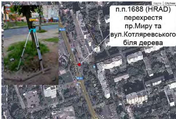
Рис. 2. Схематичне розташування пп. 1688 (Градецький HRAD)