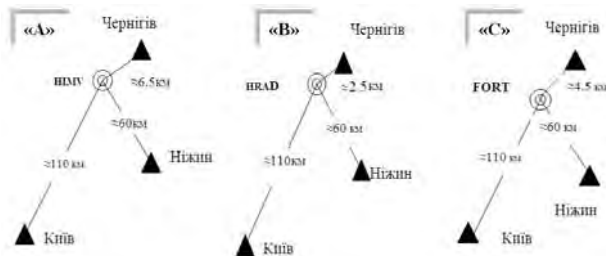
Рис. 4. Методика виконання польових робіт на досліджуваних ділянках

режиму 3600, хоча за стандартними налаштуваннями кількість вимірів становить 5 позиціонувань для точок і 10 для вершин ліній/полігонів (тобто 5 і 10 с відповідно). Методика виконання досліджень на об'єктах "А", "В" та "С" (рис. 4) і полягала у такому.