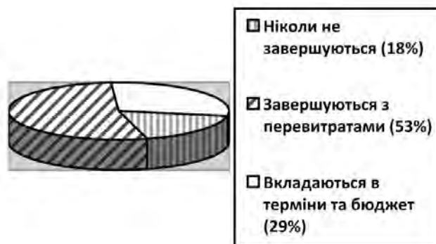
Рис. 2. Статистика щодо успішності програмних проектів

За статистикою, 18 % програмних проектів ніколи не завершуються, 53 % проектів з розроблення ПЗ завершуються з перевитратами на 56 % і перевищенням термінів на 84 % і лише 29 % проектів вкладаються у терміни та бюджет (рис. 2).