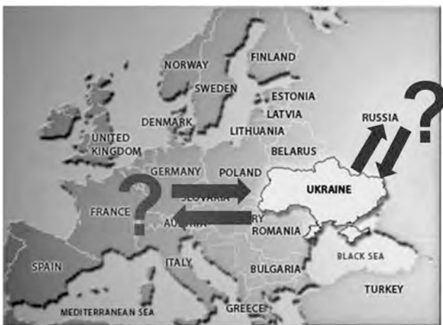
Рис. 2. Возможна ли переориентация кооперационных связей?

В условиях глобальных политических потрясений, в которые ввергнута Украина, задача фактически сводится к вопросу о необходимости коренного изменения схемы международной производственной и научно-технической кооперации путем ее переориентации с российского направления на другие регионы и страны, что по своему масштабу и сложности сродни с реформацией, только кооперационной (рис. 2).