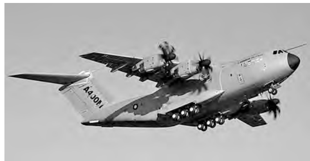
Рис. 3. Проект Ан-70 так и не стал основой самолета А400М.