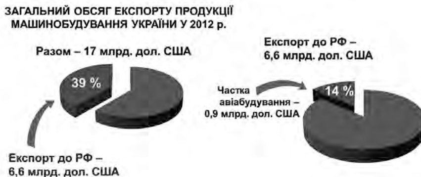
Рис. 1. Структура экспорта украинской машиностроительной продукции в Россию

скую программу развития авиационной промышленности Украины на период до 2020 года, проект которой был разработан еще в конце 2009 года, претерпел до настоящего времени четыре доработки, но так и не был принят. Наличие такой программы позволило бы, по меньшей мере, сохранить авиационную промышленность Украины как наукоемкую