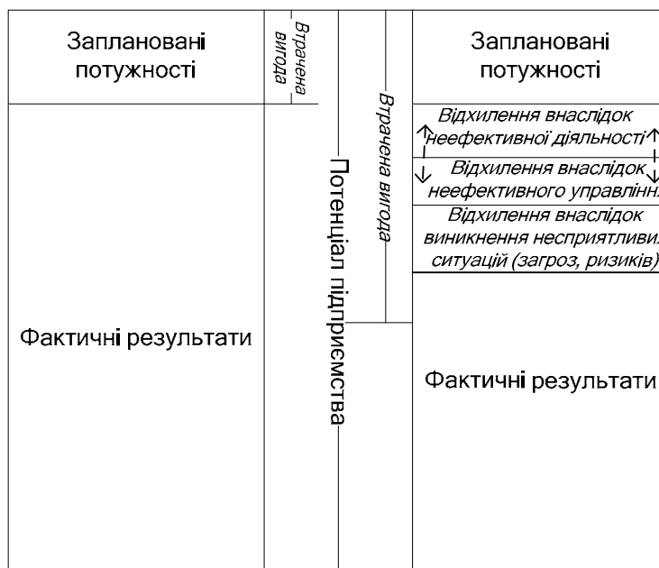
Рис. 2. Концептуальна схема дослідження втраченої вигоди підприємства (сформовано автором)

Досліджуючи явище "втраченої вигоди" підприємства на основі ресурсного підходу, зазначимо, що воно тісно пов'язане з поняттям потенціалу підприємства (рис. 2).