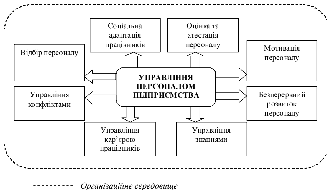
Рис. 2. Складові інноваційної системи управління персоналом

Висновки і перспективи подальших досліджень. Отже, інноваційний тип сучасного виробництва по-новому формулює проблему професійної успішності, що, своєю чергою, зумовлює необхідність формування особливих систем відбору персоналу, його оцінювання, професійної підготовки та адаптації працівників тощо. Інноваційні структури потребують пошуку нетрадиційних соціальних технологій та вимагають від персоналу гнучкості та креативності мислення, ефективної системи сприйняття інформації, внутрішньої потреби до творчості, самореалізації та інтеграції у соціальну систему. Центральною фігурою у інноваційній діяльності стає інтелектуал, для якого найважливішу роль відіграє змістова наповненість праці та висока внутрішня мотивація.