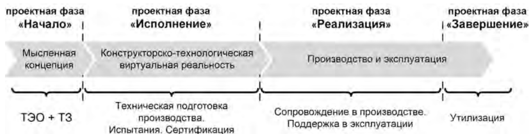
Рис. 3. Фазовые переходы состояния изделия в ЖЦИ и ЖЦП

(на последнем этапе проекта запускаются процессы планового завершения проекта).