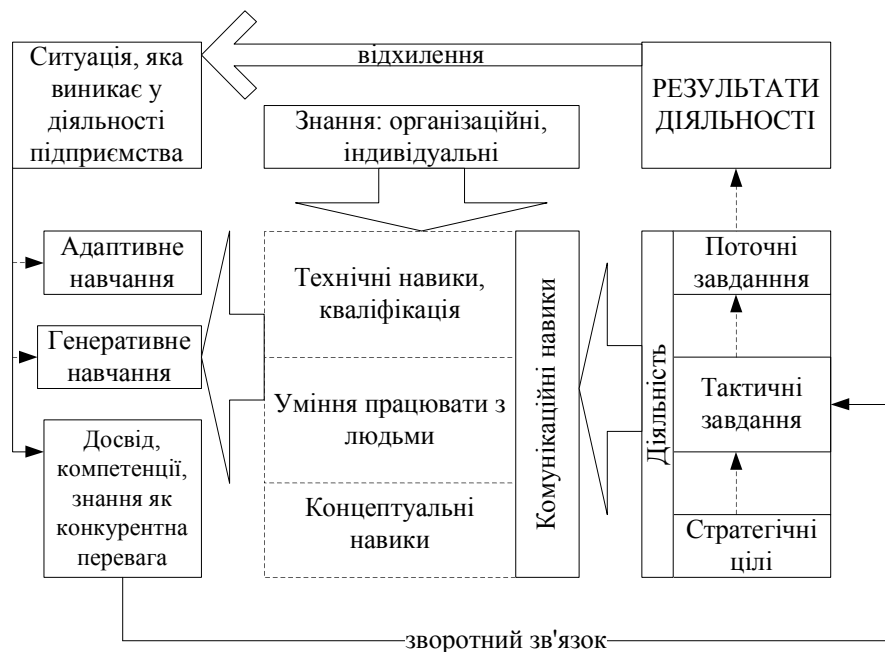
Рис. 2. Процес формування та використання знань у ситуаційному управлінні на підприємстві (авторська модель)

Необхідно наголосити, що ситуаційне управління за будь-яких обставин повинно ґрунтуватись на дотриманні загальних наукових засад управлінської діяльності.