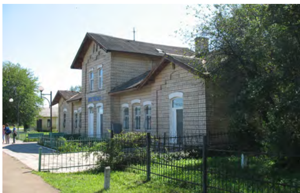
Рис. 34. Вокзал Мостиська-1