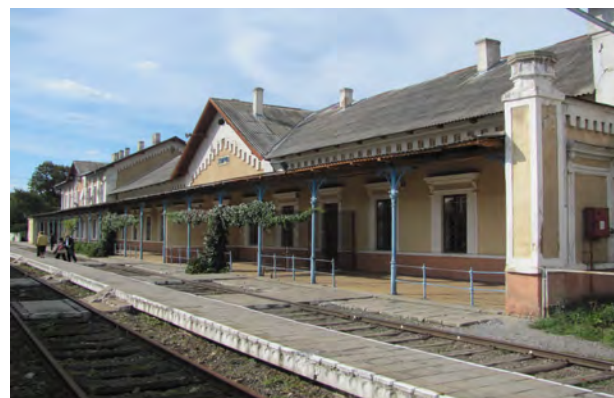
Рис. 35. Вокзал Хирів

Вокзал вузлової станції у Хирові, який сполучає гілки між Перемишлем, Самбором та Лупковом, слід зарахувати до цього ж композиційно-стильового типу (рис. 35).