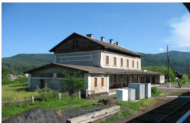
Рис. 14. Вокзал Микуличин