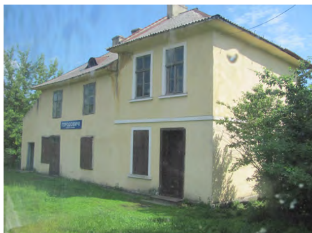
Рис. 3. Вокзал Городовичі