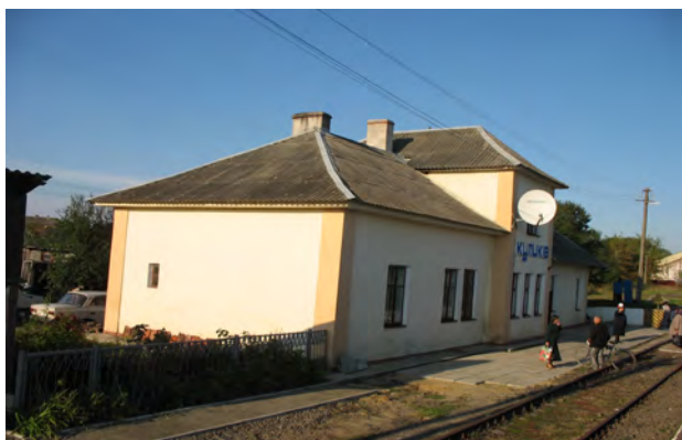
Рис. 36. Вокзал Куликів

Липник. Характерною рисою у них є високий центральний блок упоперек середини споруди, який покритий помітно вищим дахом над одноповерховим будинком з мансардою. Цей середній блок виступає ризалітом; форма даху має різний вигляд, хоча скоріш за все вона була первинно складною (як зараз є у Глинську, рис. 38). Залізнична гілка Львів – Рава-Руська вступила до дії у 1889 р. (рис. 36–39).