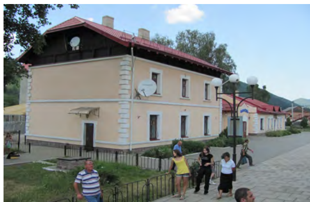
Рис. 15. Вокзал Ворохта