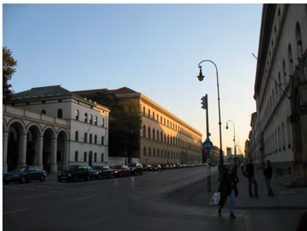
Рис. 8. Громадські будинки на вул. Людвігтрассе в Мюнхені