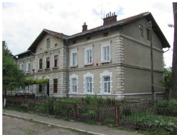
Рис. 11. Службове житло у Ходоріві