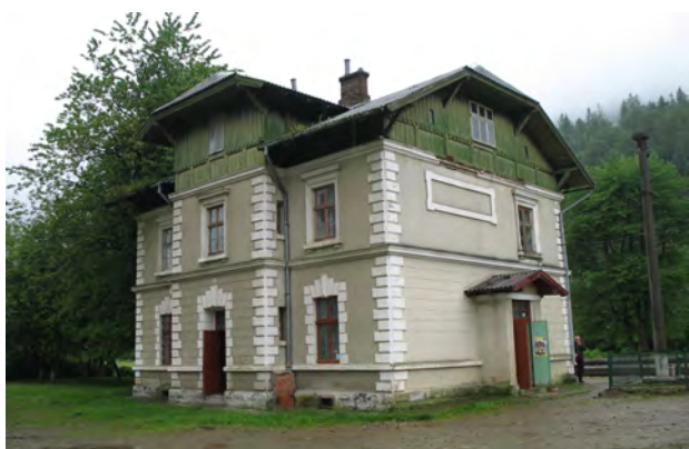
Рис. 16. Вокзал Гребенів