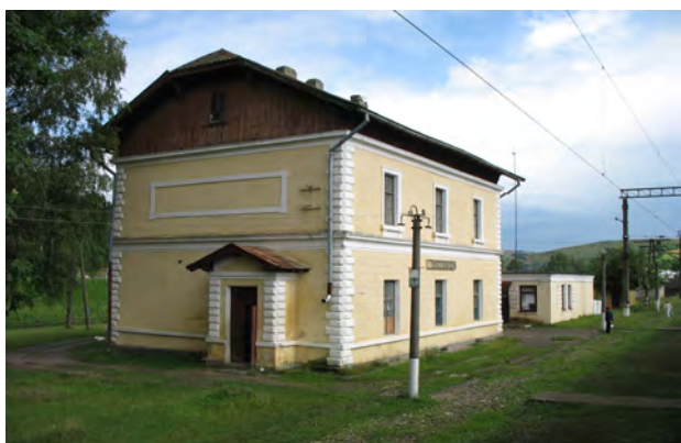
Рис. 18. Вокзал Ясениця