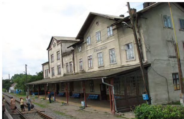
Рис. 27. Вокзал Стефанешти

Тип “Самбірський”. Низка будинків пасажирських станцій виконано за одним проектом з невеликими відмінностями: поздовжній двоповерховий з мансардним рівнем цегляний блок споруди покритий високим чотириспадістим дахом з виразним симетричним загостреним догори фронтоном із вигнутими барокоподібними симетричними волютами на бокових стінках – головні зовнішні пластичні та композиційні ознаки цього типу.