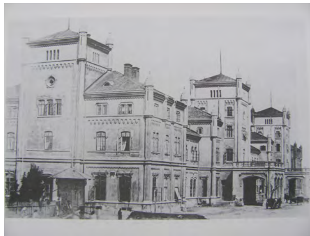
Рис. 9. Перший вокзал Карла Людвіга у Львові

Тип “Рустиково-стріховий”. Поширеним пластичним мотивом є умовно названий “Рустиково-стріховий” тип, який має вигляд двоповерхової будівлі з двоспадистим дахом з начілкою (напіввальмовий дах). Дах опирається на кам’яну кладку, а піддашшя обшальоване деревом, що помітно вирізняє його від інших типів. Рустування кутів стін і ризалітів, а подекуди цілого партерного рівня разом з виразними наличниками вікон створюють враження міцності та стійкості, а дах з філігранними дерев’яними випустиами і деталями – затишку і спокою.