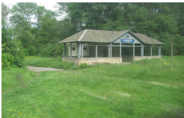
Рис. 40. Будівля станції Бовшів

Крім виокремлених композиційно-стильових типів, існують архітектурно виразні та самобутні пасажирські будівлі цього історичного періоду, які виконані за індивідуальними проектами і не належать до жодних названих типів – вокзали у Золочеві, Зборові, Озерній, Отинії/Отині, Татарові, Ділятині/Делятині та ін. Два останні перебувають у поганому стані та використовуються частково. Палациковий вокзал у Ділятині та романтична будівля у Татарові роблять їх неповторними і воляють про реставрацію (рис. 42, 43), а на вокзалі у Глібовичах (рустиково-стріховий тип) практично уже немає вікон і дверей (рис. 44)! Сумними є будинки на станціях Пługів, Нове Місто, Доброміль, Надиби та інші. Недавно зруйновано колишній вокзал у Підмонастирі (рис. 45).