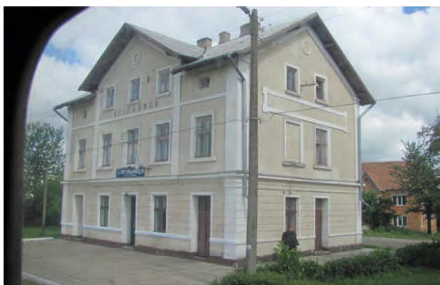
Рис. 22. Вокзал Ягільниця