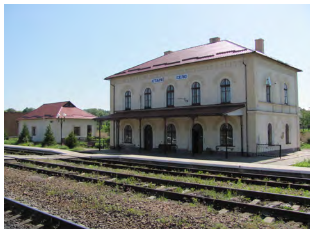
Рис. 4. Вокзал Старе Село