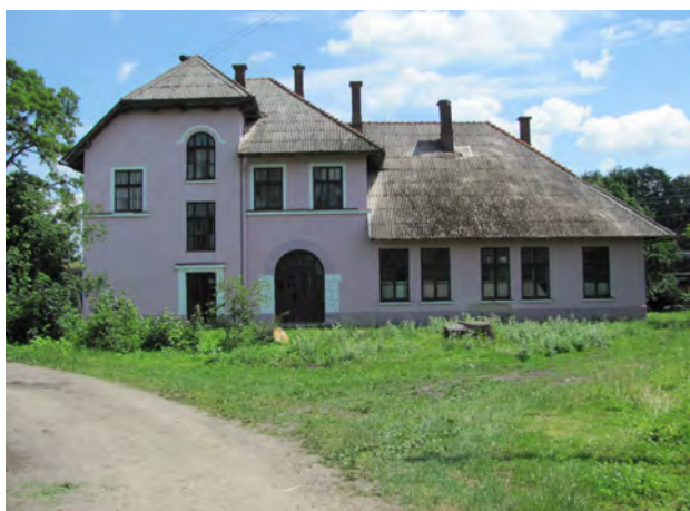
Рис. 2. Вокзал Нижанковичі

Названі будівлі збереглись зовні у майже незміненому вигляді, а перші вокзали Львова – Чернівецький і Карла Людвіга (1860- ті рр.) – були виконані власне цим стилістичним прийомом (рис. 9). Колія Львів – Чернівці, власне тільки на якій наявний названий тип, вступила до дії у 1866 р. і у 1869 р. – до Сучави.