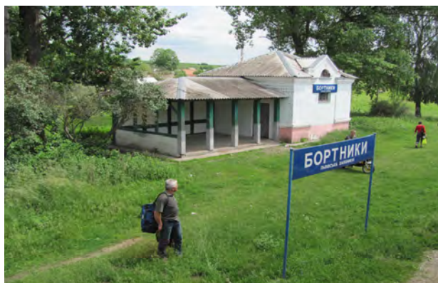
Рис. 41. Будівля станції Бортники