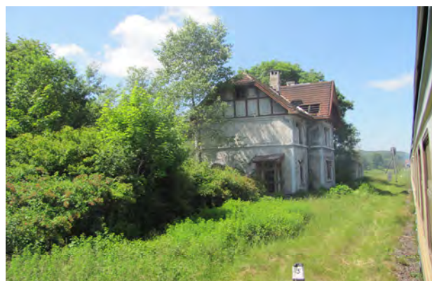
Рис. 45. Неіснуючий вокзал Підмонастир

Велика частина станційних будівель Галичини знищена під час воєнних дій, інша – перебудована. Декотрі ледве нагадують про своє давнє “обличчя” (вокзали у Городку, Самборі, Ходорові, Красному, Жовкві, Раві-Руській та ін.; рис. 46). У разі збереження самої будівельної субстанції, що є, безумовно, позитивним явищем останнього десятиліття, спостерігається доволіне поведіння з фасадом, дахом, матеріалом і способом покриття та ін. Різномірні прибудови, перебудови, викінчення стінових поверхонь тощо часом нівечать архітектурний образ (наприклад, укорочення будинку на станції Рогатин (рис. 47), прибудови та замурування вікон на Березо-