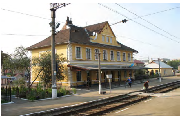
Рис. 30. Вокзал Старий Самбір