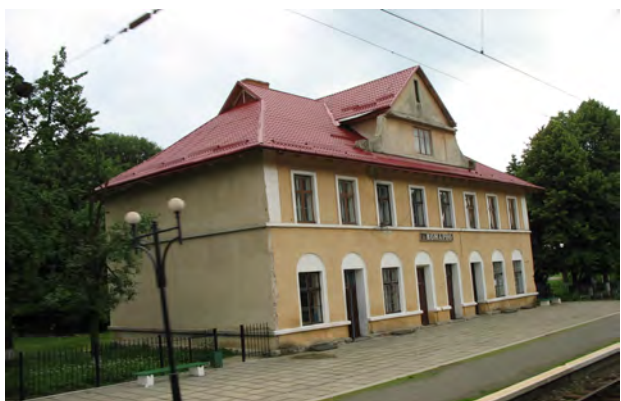
Рис. 28. Вокзал Комарно

Тип “Мостиський”. Типологічну і стилістичну подібність мають вокзали у Мшаній, Судовій Вишні та Мостиськах – 1, які розміщені на одній гілці Львів – Перемишль. Спарені дверні прорізи партеру та вікна другого поверху зі своєрідним рисунком рустування ризаліту і спадисті дахи – головні візуальні риси цих будинків. Неіснуючий вокзал у Городку також належав сюди. Залізничне сполучення розпочато по цій лінії у 1861 р. (рис. 32–34).