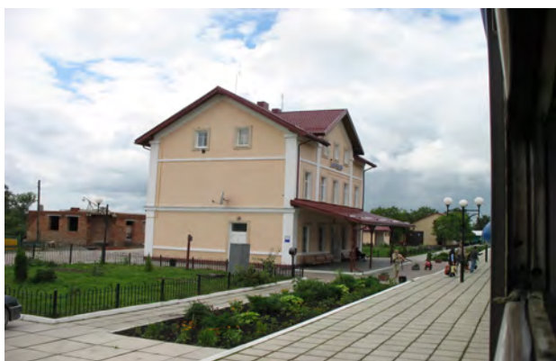
Рис. 24. Вокзал Борщів