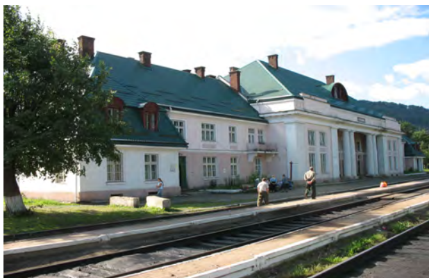
Рис. 42. Вокзал Ділятин