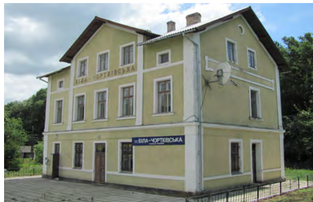
Рис. 21. Вокзал Біла-Чортківська