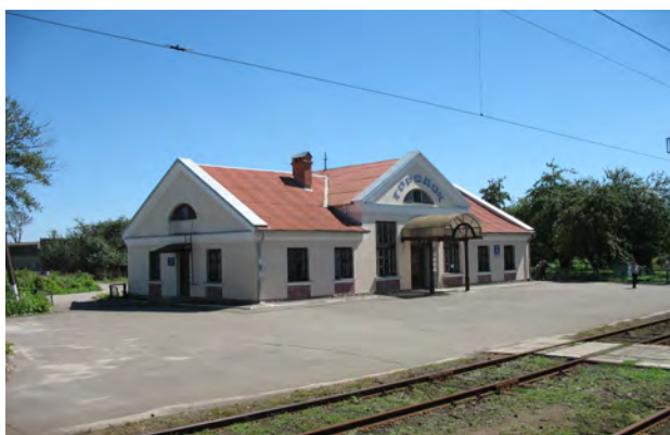
Рис. 46. Вокзал Городок

Покинутість і занедбаність багатьох будинків вокзалів непереконливо пояснюється територіально-розпланувальними змінами поселень (наприклад, Пługів, Підмонастир) чи економічною нерентабельністю та браком коштів, а є свідченням байдужості і незнання цінності архітектури об'єкта. Це виглядає щонайменше дивним на тлі появи багатомільйонних столичних та інших залізничних вокзалів-гігантів.