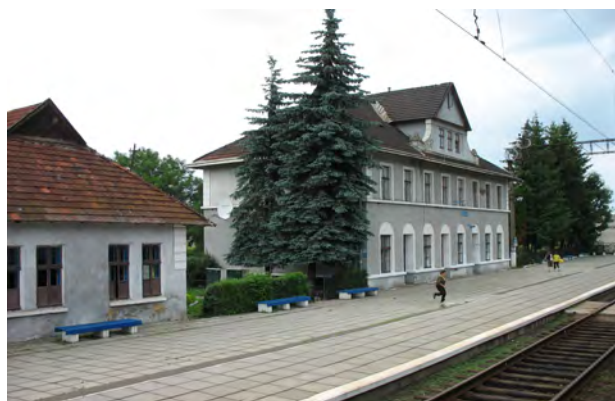
Рис. 29. Вокзал Рудки