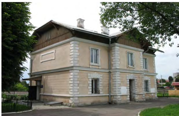
Рис. 12. Вокзал Львів–Сухів