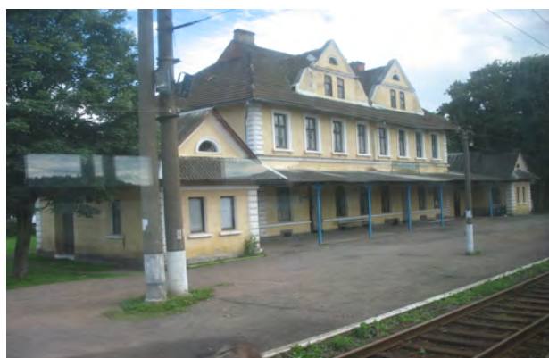
Рис. 31. Вокзал Стрільки