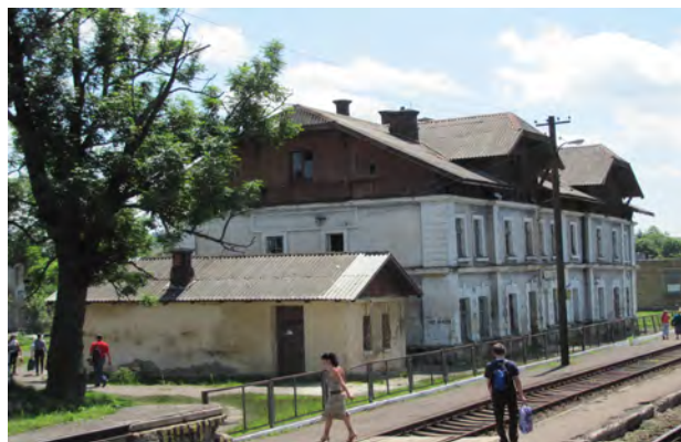
Рис. 13. Вокзал Глібовичі