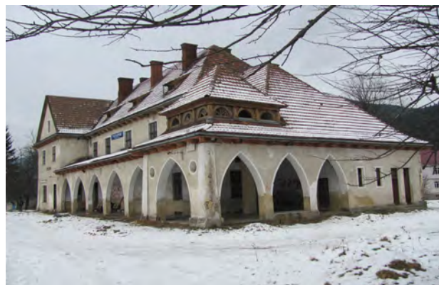
Рис. 43. Вокзал Татарів