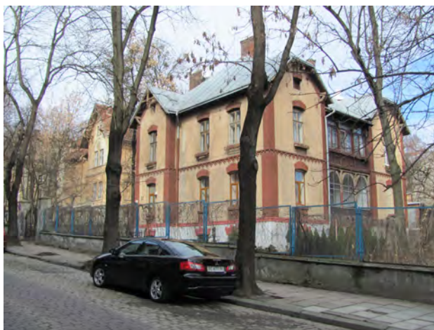
Рис. 10. Житловий будинок на вул. Н.-Левицького у Львові

До таких характерних прикладів слід зарахувати вокзали станцій Львів–Сихів, Глібовичі, Братківці, Тарновиця, Надвірна, Лосєва, Микуличин, Ворохта, Гребенів, Тухля, Турка, Ясениця, Соколики, Жидачів, Рогатин, Теревовля, Копичинці, Криве, Денисів–Купчинці, Ходачків–Великий, Березовиця–Острів та ін. Територіально цей тип пасажирських станційних будинків є найпоширенішим по краю (рис. 12–19). У межах цього типу можна розрізнити декілька підтипів, зокрема за розмірами, способом примикання допоміжних споруд, наявністю фронтонів (Жидачів, Денисів–Купчинці) та ін. Цим самим стилістичним прийомом були виконані тепер неіснуючі станції Бескид, Потутори та ін.