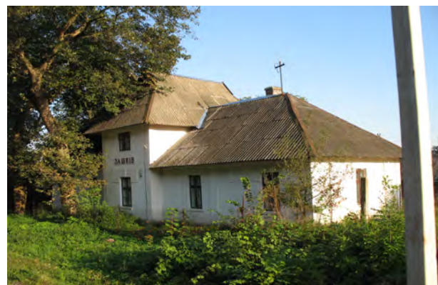
Рис. 37. Вокзал Зашків