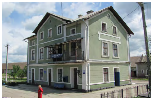
Рис. 23. Вокзал Товсте