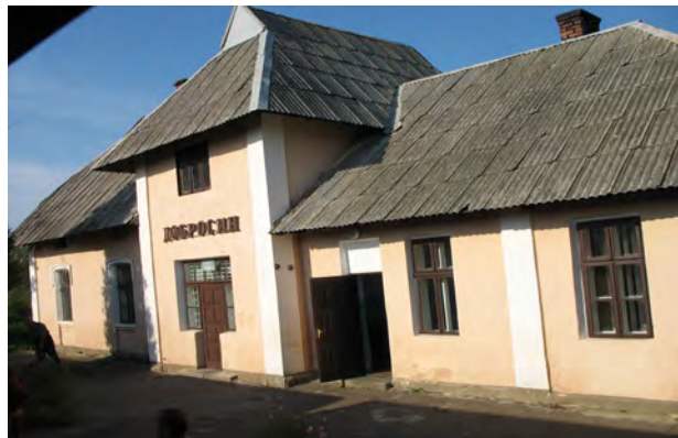
Рис. 39. Вокзал Добросин

Тип “Павільйонний”. У Галичині зустрічаються малі пасажирські станційні споруди у вигляді окремих павільйонів чи павільйонів (навісів) сполучених із мурованою спорудою. Частіше вони трапляються на залізничних пристанках, хоча насправді є рідкісними (станційні споруди Бовшів, Бортники, Цуцилів) і побудовані ближче до завершення досліджуваного періоду, чи вже у середині ХХ ст. (рис. 40, 41).