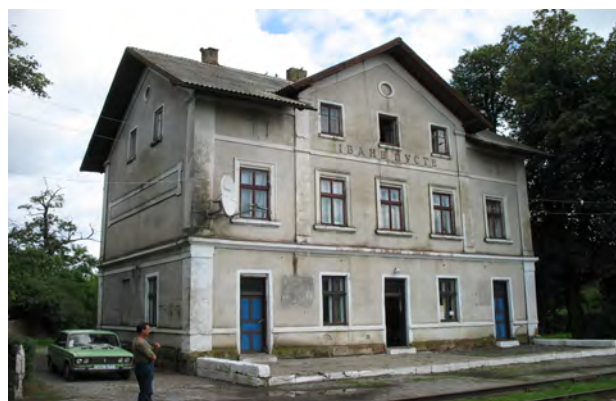
Рис. 25. Вокзал Іване-Пусте

Такий тип станційних будинків є у Вигнанці, Білій-Чортківській, Ягільниці, Товстім, Борщові, Іване-Пустім, а також у Вишніці та у Стефанештах/Стефанівці у Північній Буковині (рис. 20–27). Цікавою станцією є Стефанешти, через яку проходить залізнична гілка від Заліщик до Городенки і Коломиї. Тут до будинку Подільського типу станції примурована близька за розмірами та композицією споруда пізнішого часу (правдоподібно, міжвоєнного) – своєрідна мультиплікація (рис. 27). Мережа колій, де знаходиться названий тип, вступила до дії 1898 р.