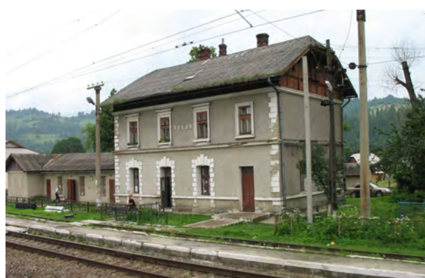
Рис. 17. Вокзал Тухля