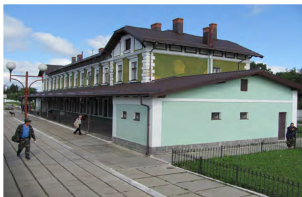
Рис. 19. Вокзал Копичинці