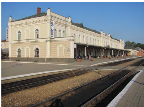
Рис. 5. Вокзал Коломия