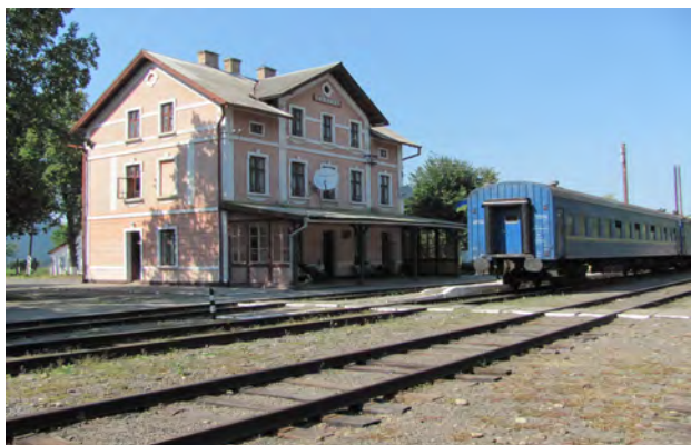
Рис. 26. Вокзал Вишниця