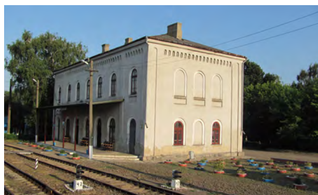
Рис. 6. Вокзал Заболотів