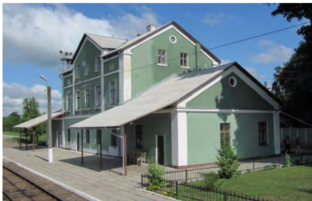
Рис. 20. Вокзал Вигнанка

Тип “Подільський”. За одним проектом зrealізовано низку вокзалів у південній частині Тернопільської області (Західне Поділля), які з плином часу набули деяких прибудов. Двоповерхова симетрична будівля з мансардним поверхом має характерною зовнішньою пластичною ознакою викінчення пілястрами кутів будинку, наличників вікон і входу, а також подекуди збереження рустування першого ярусу та круглих віконців на трикутних фронтонах.