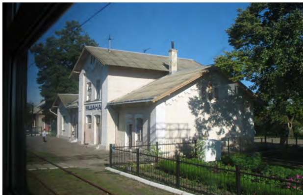
Рис. 32. Вокзал Мишана