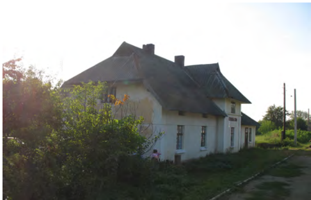
Рис. 38. Вокзал Глинське