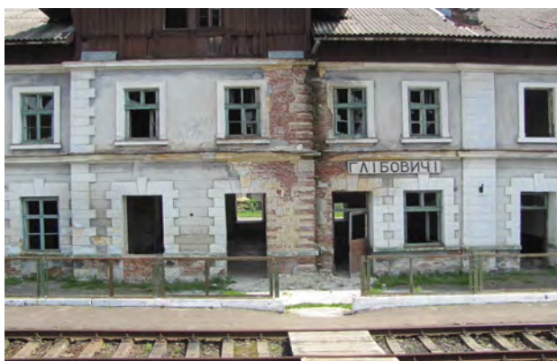
Рис. 44. Фрагмент вокзалу Глібовичі