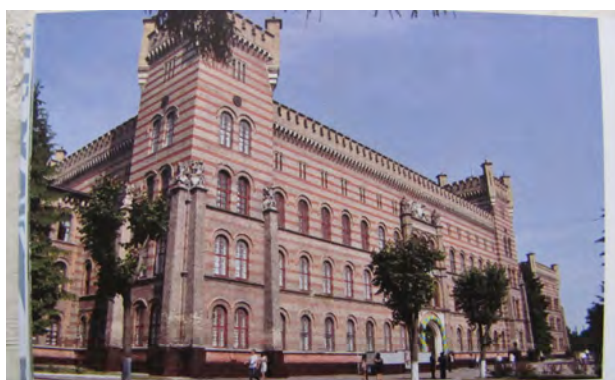
Рис. 7. Колишній Будинок інвалідів у Львові [Фото 11]