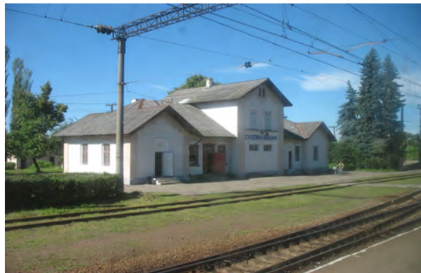
Рис. 33. Вокзал Судова Вишня