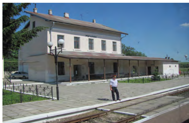
Рис. 47. Вокзал Рогатин