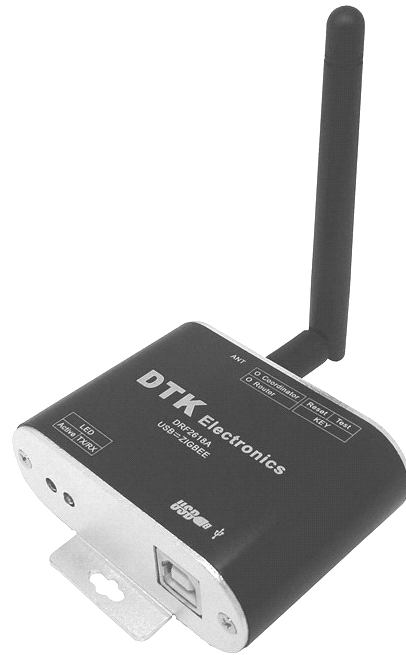
Рис. 2. Приймально-передавальний пристрій ZigBee