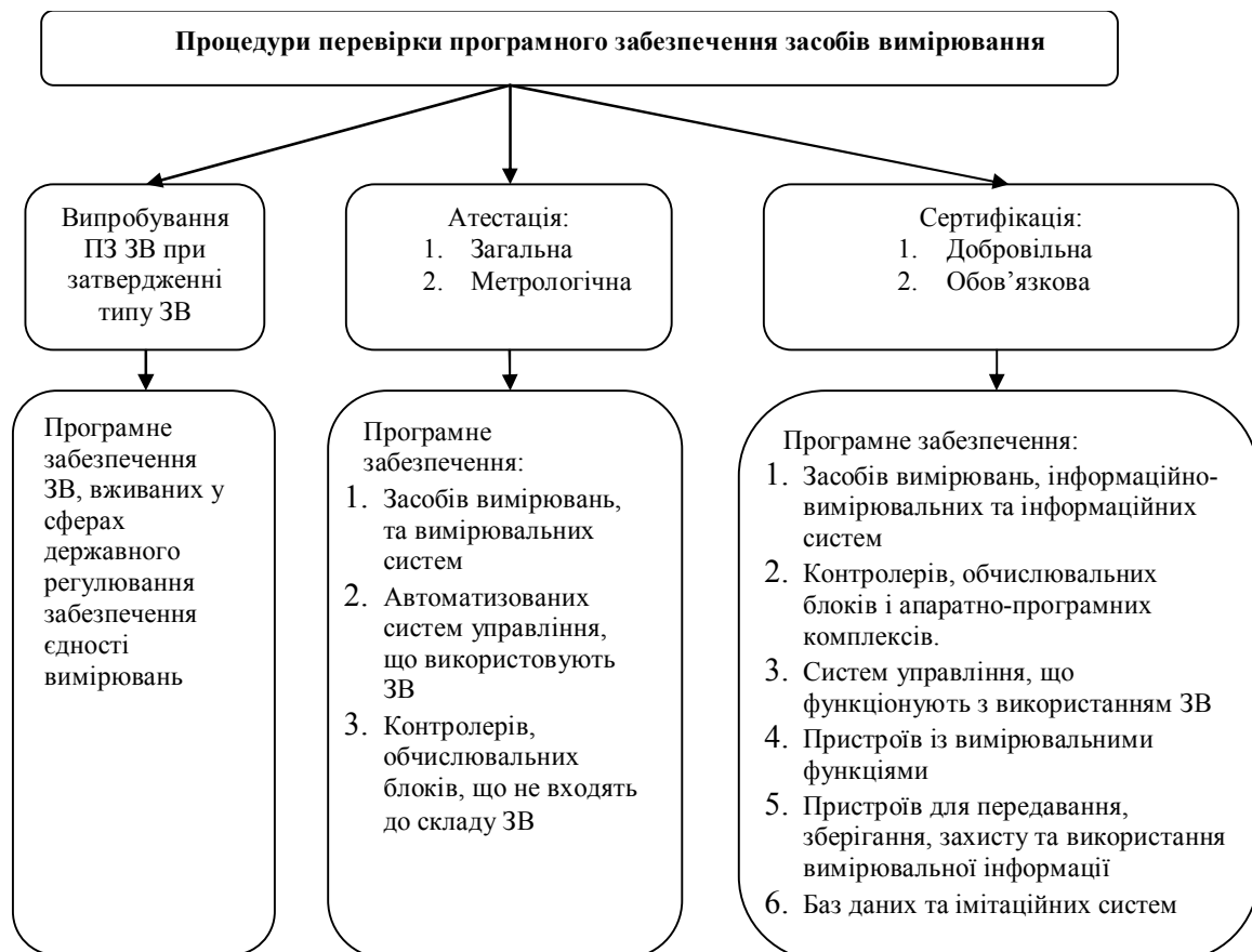
Рис. 1. Процедури перевірки програмного забезпечення засобів вимірювання

Пункти 3 і 4 цієї класифікації доцільніше зберегти до загальної перевірки ПЗ, а не метрологічної, тому що ніяких вимірювальних чи обчислювальних дій, які впливають на результати вимірювання, вони не виконують. Ці пункти характеризують правильність функціонування програмного забезпечення загалом.