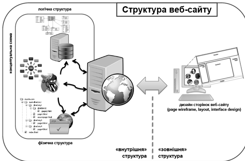
Рис. 1. Структура веб-сайта – просторова інтерпретація

слід думати, що наявність клієнтської частини веб-сайта допускає інтерпретацію поняття фізичної структури із файловою структурою на боці користувача. Справді, браузер отримує від сервера відповідь у вигляді HTML-коду, який змушує браузер створювати часткову проекцію фізичної структури веб-сайта (зокрема у вигляді файлів ОС) на боці клієнта. Тобто фактично клієнтська проекція веб-сайта та способи її обробки цілком є прерогативою браузера, але в жодному разі не є складовою частиною структури веб-сайта, а особливо фізичної. Щодо логічної структури, то тут маємо однозначну залежність від технологій, які застосовуватиме браузер. Отже, клієнтська частина оперує лише структурою HTML-сторінки та її складових, що створюють деяку тимчасову часткову проекцію структури веб-сайта на клієнтській машині. І навіть більше, дизайн сторінок та їх наповнення повністю формується на сервері, що ставить під сумнів правомірність розгляду такого поняття, як “зовнішня структура” веб-сайта.