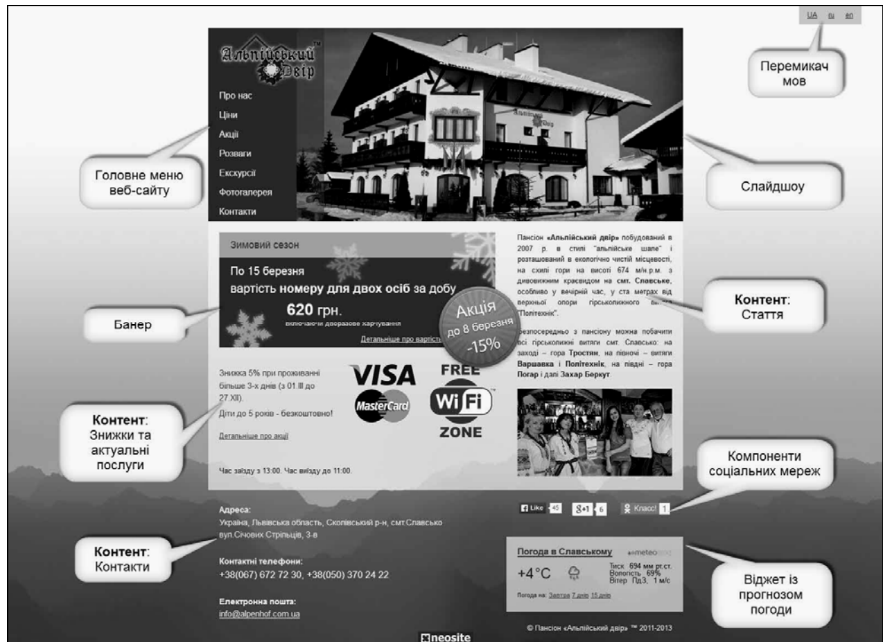
Рис. 2. Функціональний підхід до аналізу структури веб-сайта

На рис. 2 наведено знімок сторінки веб-сайта [14], на якій позначено основні елементи, що функціонально реалізують логічну структуру сайта. На рис. 3 подано зразок HTML/CSS-структури, яка втілює логічну структуру сайта у елементах окремої сторінки веб-сайта [14], на рис. 4 – зразок окремої сторінки веб-сайта [14].