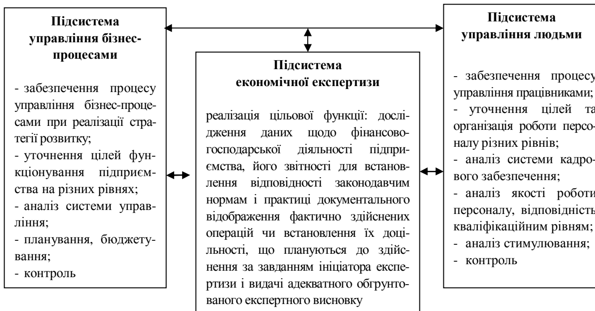
Рис. 1 Застосування економічної експертизи в контурах моделі контролінгу А. Дайле

Так, методологію PDCA щодо вирішення питання про економіко-експертну службу на підприємстві можна коротко описати так (рис. 2):