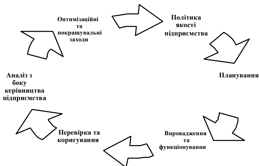
Рис. 2. Модель системи менеджменту економіко-експертної служби підприємства

Дійте: постійне поліпшення показників діяльності підприємства за рахунок якості управлінських рішень на основі отриманих висновків експертних досліджень.