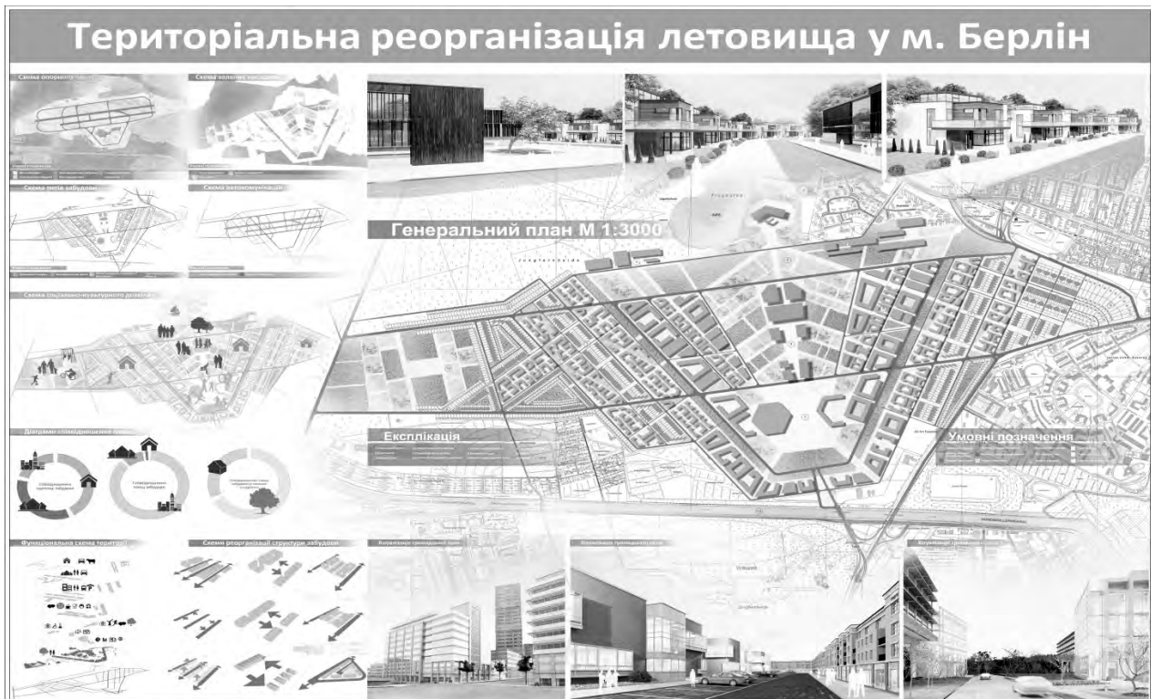
Рис. 3. Конкурсний проект на тему “Територіальна реорганізація лєтовища TEGEL у м. Берлін”. Автори: І. Миронюк, О. Суворецька та А. Стопачинський, керівники проф. В.І. Проскураков та асист. Ю.Л. Богданова

розвиток житлової зони. Аеропорт історично збирає на своїй території велику кількість людей, тому для збереження цієї функції запропоновано створення тут громадської зони, яка формується навколо головного терміналу і слугуватиме для зустрічей, знайомства і спілкування людей. Навколо основної осі розвиватиметься житлова забудова із зміною поверховості (рис. 3).