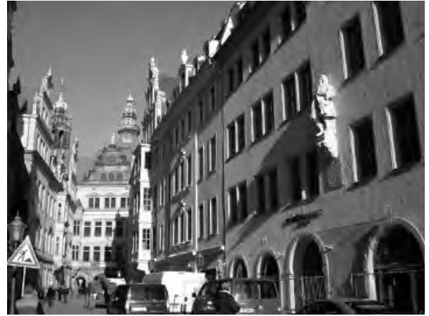
Рис. 10. Вид з вулиці Шльос на Георгентор

Переходячи Аугустівський міст з видом на бароковий ансамбль старого міста (Шльос, Хофкірхе, Земперопер і Георгентор), що завжди мені приносить багато задоволення, я майже закінчую мою прогулянку. Йдучи вулицею Шльос, я на мить зупиняю свій погляд на вигнутому скляному даху Пітера Кулька, що накриває внутрішній двір Шльосу. Цей нещодавно побудований за історичними планами квартал VIII знову творить з Георгентор добре сформований міський простір, що, на мою думку, майже нагадує велику кімнату. Таких місць зі схожою атмосферою до Другої Світової війни було декілька. “Наскільки ж вдало це було?”, запитую я себе знову і знову. З поворотом наліво в Шпорергасе я врешті-решт доходжу знову до Ноймаркт – початкової точки моєї прогулянки по місту.