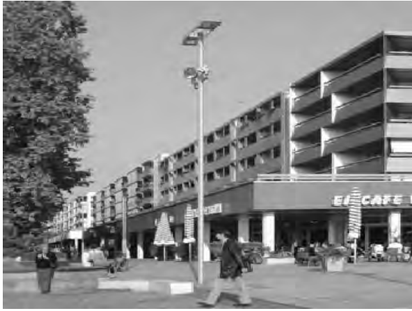
Рис. 9. Вулиця Хаупт