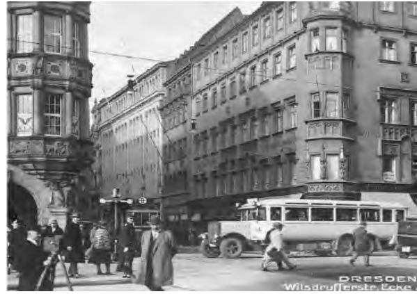
Рис. 4. Вулиця Вільсдруфер у 1930 р.

На шляху з Ноймаркт я проходжу повз Палац культури – ще один містобудівний елемент соціалістичного міста, який замикає Альтмаркт на півночі. Сьогодні інтер'єри цієї (відносно пропорцій Дрездена) монументальної споруди перепланувало німецьке архітектурне бюро Gerkan, Marg & Partner (gmp) проти волі недавно померлого дрезденського архітектора Вольфганга Хентша, який до останнього подавав до суду. Я переходжу широку вулицю Вільсдруфер у напрямку Альтмаркт. У часи НДР ця історично торговельна вулиця перетворилась на бульвар (проспект), була спрямлена і виконувала функції східно-західної магістралі. Зараз ніщо не нагадує про колишню вузьку вулицю.