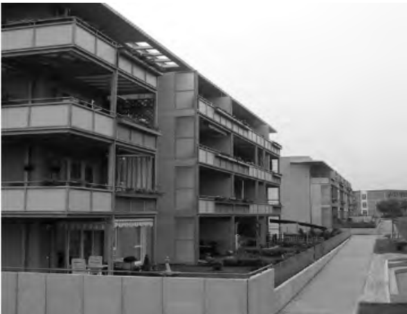
Рис. 7. Реконструйований будинок у житловому поселенні Кройтер

Від району Гехт я їду вздовж дороги Бішоф, повз парк Аляун, до Ойсере Нойштадт – щільно забудованого району грюндерської епохи, який в часи Другої світової війни майже не постраждав. Внаслідок своєї різноманітності та фрагментної структури використання він став набагато привабливішим, мультикультурним житловим районом для студентів, молодих сімей, а також для заможних молодих бізнесменів. Протягом дня ця частина міста є добре функціонуючим районом, а ввечері завдяки своїм пабам, барам та ресторанам перетворюється на розважальний район. Цей в часи НДР занедбаний проблемний район сьогодні є майже повністю відновлений.