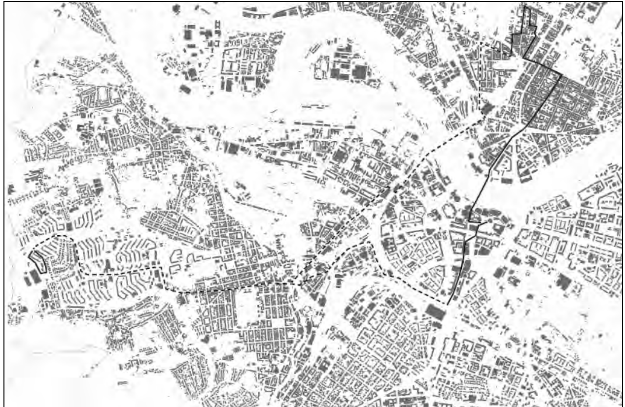
Рис. 2. Генплан Дрездена із маршрутами прогулянки містом (суцільна лінія) і поїздки на трамваї (штрихова лінія)