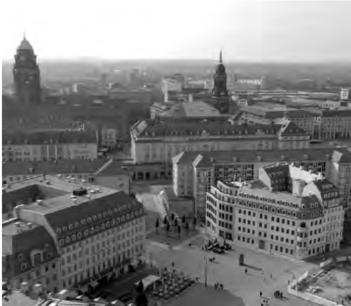
Рис. 1. Вид з Фрауенкірхе на частину площі Ноймаркт у напрямку вулиці Прагер

особливого значення? Гуляючи містом, ці контрасти можна легко помітити. Тільки під час руху міськими просторами сприймаються співвідношення, які, розглядаючи окрему споруду, ми не можемо відчувати. Споруда взаємодіє з навколишніми будинками чи іншими просторовими об'єктами, і цей зв'язок пронизує місто в його сітці відкритих просторів. Якщо ви насправді хочете сприйняти будинки в їхньому середовищі, ви неминуче підійдете до найближчого об'єкта, який найбільше звертає на себе увагу. Проходити через багатшарове місто – це як читати книгу. Слово за словом. Речення за реченням. Отже, щоб визначити шлях прогулянки через місто, варто довіритися тільки своїм інстинктивним інтересам.