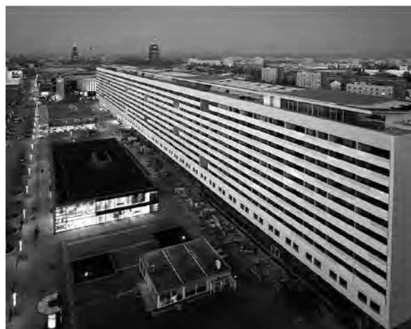
Рис. 6. Празький ряд після реконструкції у 2007 р.

За цим районом починається Горбітц – найбільше житлове поселення післявоєнного Дрездена. Цей міський район знаходиться на схилі західної околиці міста, тому він завжди піддавався критиці за те, що не був запланований в зоні чистого повітря. В часи НДР створювалися панельні житлові райони у зв'язку з використанням нового планування за сучасними стандартами, що мало велику підтримку з боку населення. Цей новий житловий мікрорайон панельної конструкції, що виник впродовж 1980 – 1989 рр., був запроєктований для 45 000 жителів і повинен був стати останнім великим поселенням Дрездена. Після переломного кризового періоду, на початку 90-х років, керівництво міста повинно було боротися зі зменшенням населення і змушено було констатувати зростаючу незаселеність Горбітца. Панельні будинки стали непривабливими, що можна сказати і про інші житлові райони Дрездена, незалежно від того, чи вони були в хорошому чи поганому стані. Хорошим прикладом реконструкції панельних будинків є невеличке поселення на північно-західній околиці Горбітца. За результатами конкурсу типові будівлі соціалістичного житлового будівництва з 2002 до 2004 рр. було переплановано на індивідуальні квартири завдяки демонтажу окремих панельних конструкцій. При цьому кількість квартир зменшилась з 829 до 270. Ці будинки було доповнено терасами, новими балконами і садами для приватного користування. Зелені зони було по-новому оформлено, внаслідок чого було досягнуто нової якості проживання.