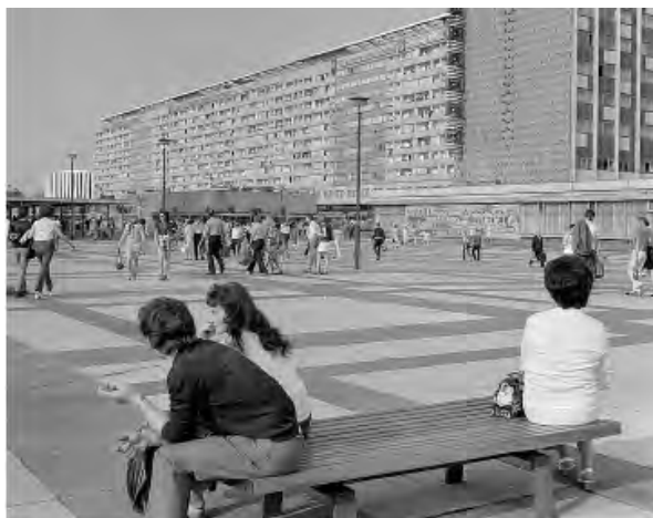
Рис. 5. Празький ряд і готель "Нева" 1973 р.

Альтмаркт і головним вокзалом, тепер (повинна була постати повністю в новому образі). Більш ніж просто широкомасштабні простори виникли в результаті початку будівництва в 1965 р. Я ще пам'ятаю, коли я переходив цю вулицю дитиною, наскільки неймовірно широкою, десь кілометр завширшки, вона мені здавалася. Сьогодні ці широкі простори можна тільки частково розпізнати, оскільки в кінці 90-х років вони були по-новому оформлені, пішохідні зони були частково звужені і тим самим було створено нову ритмічну послідовність. Звертає увагу 270 метрів завдовжки і 12 поверхів заввишки житловий будинок, названий Празьким Рядом (Prager Zeile) – тоді це був найбільший житловий будинок в НДР. У 2007 р. його реконструювало дрезденське архітектурне бюро Kneger & Lang, архітектори переформили фасад згідно із сучасними тенденціями і перепланували цей будинок на 560 квартир з різним плануванням. В кінці вулиці Прагер я доходжу до реконструйованого Норманом Фостером головного залізничного вокзалу, тут я сідаю на трамвай в напрямку Горбітц. Дорогою туди я проїжджаю повз побудований Тхобаном Фосом світовий торговельний центр. Трамвай їде деякий час багатолюдною вулицею Кессельсдорф, яка поступово підіймається вгору. Праворуч і ліворуч знаходяться різноманітні торговельні лавки і великі ринки, які є основою міського району Льобтау.