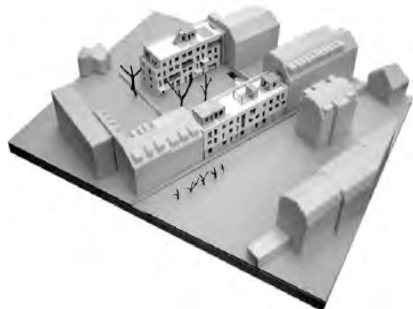
Рис. 8. Будинки на вулиці Зайтен, макет (фото з будівельного форуму)

Я їду тепер в південному напрямку, переходжу велике дорожнє кільце площі Альберта і прямую вулицею Хаупт в центральному районі Нойштадт. Південний кінець вулиці Хаупт завершує Нойштедтер Маркт із “Золотим Вершником” – пам’ятник на честь Аугуста д. Штаркен (курфюрст Саксонії і король Польщі). В кінці 70-х років площу Нойштедтер Маркт зі своїми типовими житловими будинками було по-новому оформлено, “найгарніші пішохідні зони НДР” засаджено платанами і клумбами, облаштовано лавками. По обидва боки вулиці побудовано п’ятиповерхові житлові будинки з невеликою кількістю ексклюзивних магазинів та ресторанів на першому поверсі. Довгі ряди будинків з одного боку посилюють ефект перспективи вулиці Хаупт, що звужувалась на північ, а з іншого – відмежовує квартали, що знаходяться за ними, від громадського простору цієї пішохідної зони. Декілька років тому декілька будинків, що розташовувалися в західній частині вулиці, було частково демонтовано. Тобто вулицю Хаїнріх знову було додано до цієї сітки відкритих просторів. На початку нового тисячоліття на площі Нойштедтер Маркт панельні будівлі також реконструювало архітектурне бюро Kperer & Lang. Було змінено фасади, і завдяки різноманітній архітектурі, кольору і матеріалу тут тепер також впізнається колишня парцельна структура міста. Комерційне використання перших поверхів збереглося, тому вулиця Хаупт і сьогодні залишається найулюбленішим місцем прогулянок.