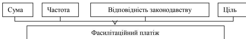
Рис. 1. Критерії зарахування платежу до фасилітаційних

Категорична заборона ФП не може бути ефективною, адже часто певні «рутинні» послуги неможливо отримати без фасилітаційної оплати. Підприємства, які не визнають ФП, не мають чіткого уявлення про те, наскільки затримка у виконанні паперової роботи пояснюється неотриманням «плати за сприяння» і якою мірою співробітникам платять її в будь-якому випадку. Водночас перед підприємствами, які дозволяють ФП, постає непросте завдання визначення критеріїв зарахування платежів до фасилітаційних, оскільки на законодавчому рівні в Україні вони не визначені. З огляду на це пропонуємо критерії зарахування платежу до фасилітаційного (рис. 1).