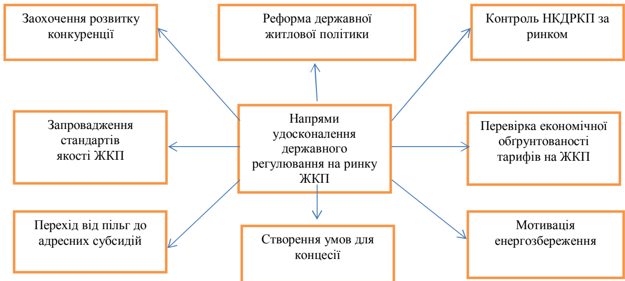
Рис.2. Основні напрями удосконалення державного регулювання на ринку житлово-комунальних послуг

Заохочення розвитку конкуренції може бути забезпечене у діяльності лише тих суб'єктів господарювання, які не є природними монополістами на ринку ЖКП (централізоване опалення, гаряче та холодне водопостачання та водовідведення). При цьому проблема створення ефективного конкурентного середовища є найактуальнішою у діяльності підприємств з обслуговування житла, оскільки у нашій державі поки що не створено інституту управляючих будинками, на яких покладалися би обов'язки щодо вибору надавача послуг та розірвання договорів, якщо мешканців відповідних будинків не задовольнятиме якість ЖКП.