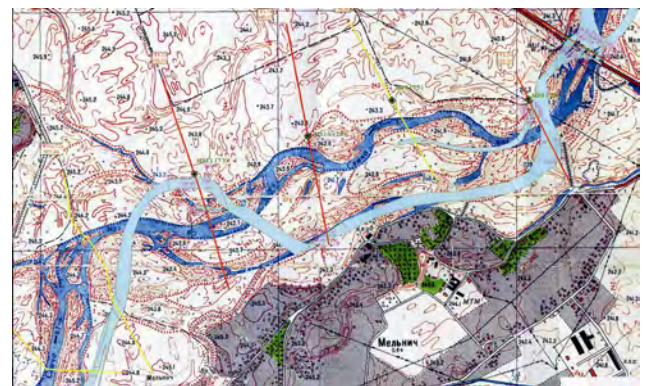
Рис. 2. Фрагмент плану річкової долини р. Свіча

Переформування елементів рельєфу русла і річкової долини досліджували на розмічених поперечних профілях (морфостворах), які спирались на реperi магістральних ходів, розташованих на право- і лівобережних дамбах обвалування. Довжини морфостворів сягають від 05 до 1,3 км. На поперечних профілях розмічено пікети через 100 м., а характерні точки рельєфу зафіксовано плюсовими точками. Всі пункти на морфостворах закріплено тимчасовими знаками. Вздовж морфостворів прокладено теодолітні ходи, для знімання ситуації, а висоти всіх рельєфних точок визначено із нівелювання. Поперечні профілі русла ріки визначено із промірних робіт. Попередній цикл спостережень на р. Свіча був проведений протягом 2000–2005 років.