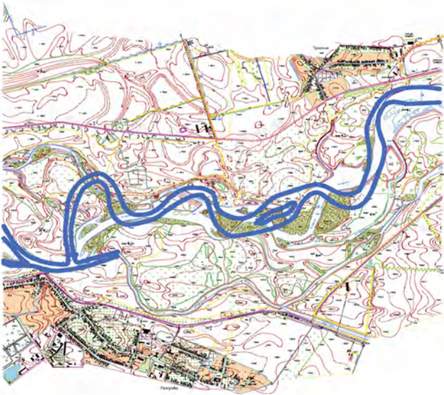
Рис. 1. Фрагмент плану річкової долини р. Тиса

Моніторингові дослідження змін морфології долинно-руслів р. Свіча, притоки Дністра, спричинених дією водних потоків під час проходження паводка 2008 р., проведено у 2010 р. Геодезичні вимірювання проводились на ділянці ріки завдовжки близько 30 км на 70 поперечних профілях (морфостворах) [2]. Основою інструментальних спостережень слугували магістральні планово-висотні ходи, прокладені по обох берегах ріки. Вимірювання виконувались згідно з нормативними вимогами до полігонометрії другого розряду. Всі пункти полігоно-