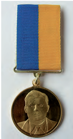
Зовнішній вигляд відзнаки

Українське товариство геодезії і картографії