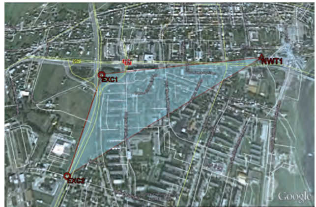
Rys. 3. Lokalizacja zespołu punktów stacji referencyjnej w Nowym Targu