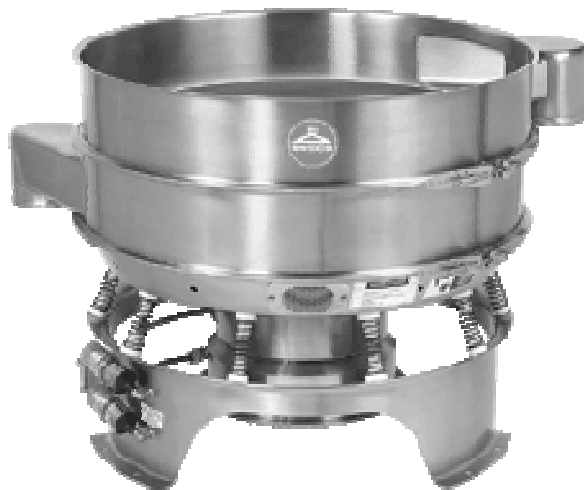
Рис. 1. Вібраційний сепаратор для розділення сипких середовищ фірми SWECO