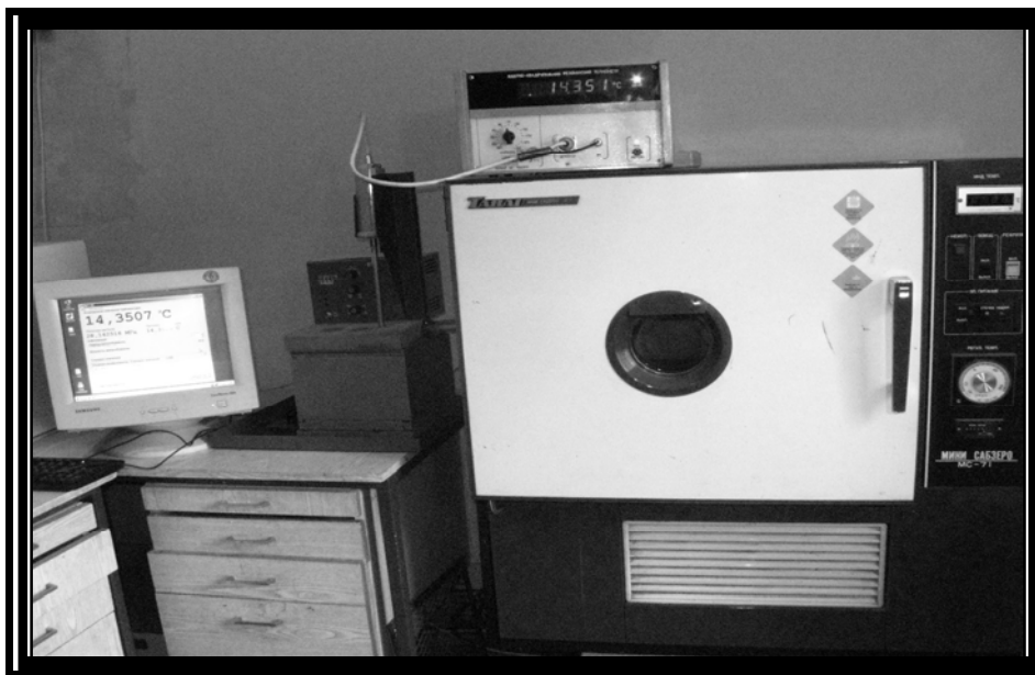
Рис. 1. Загальний вигляд вимірювального комплексу

Ядерно-квадрупольний резонансний термометр ЯКРТ-5М не має аналогів в Україні та Європі. Прилад належить до нестандартного обладнання і призначений для застосування як еталонний засіб для калібрування, перевірки і атестації засобів вимірювання температури з високою точністю в метрологічних центрах та метрологічних службах підприємств. Термометр ЯКРТ-5М забезпечує відтворення одиниці температури з середньоквадратичним відхиленням ( S ) 0,001К з неусуненою систематичною похибкою ( \theta ) не вище за \pm 0,003К .