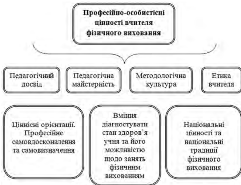
Рис. 1. Професійно-особистісні цінності вчителя фізичного виховання

На нашу думку, педагогічна майстерність на засадах аксіології – це якість виконання педагогічних завдань, яка залежить від: професійно-педагогічних знань, аксіологічної спрямованості особистості вчителя, методичного досвіду, професійно-особистісних якостей вчителя та креативного підходу до педагогічного процесу. Педагогічна майстерність вчителя фізичного виховання на засадах аксіології ґрунтується на гуманістичних принципах педагогіки (рис. 2).