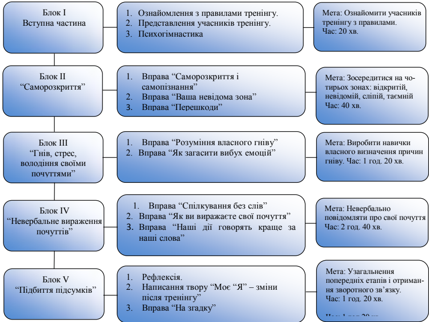
Рис. 1. Структура “Програми формування позитивного ставлення батьків до дітей з аутизмом”

ність до нестандартних рішень у ситуації невизначеності, інновації, творчості; підвищення самооцінки, перебудова і гармонізація образу себе.