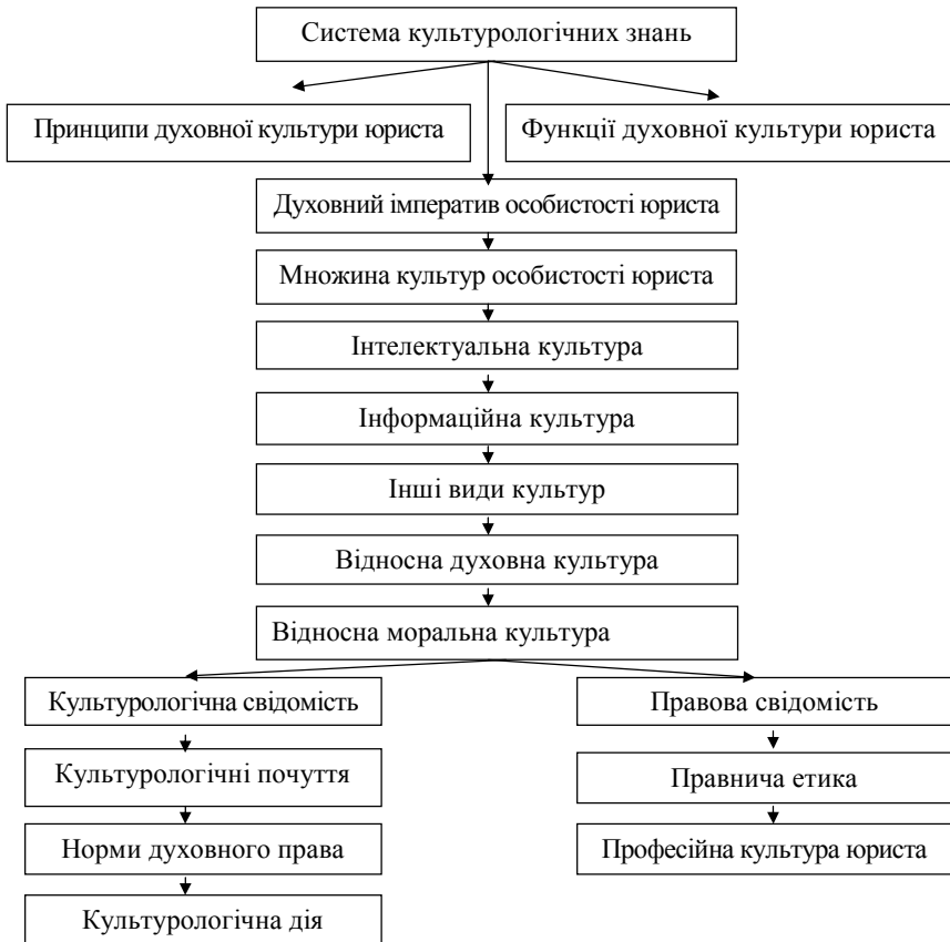
Рис. 2. Культурологічний комплекс із формування духовної культури магістра права

змісту юридичних законів, формують у юриста найвищі духовні цінності, розвивають його духовну свідомість як захисника добра і милосердя.