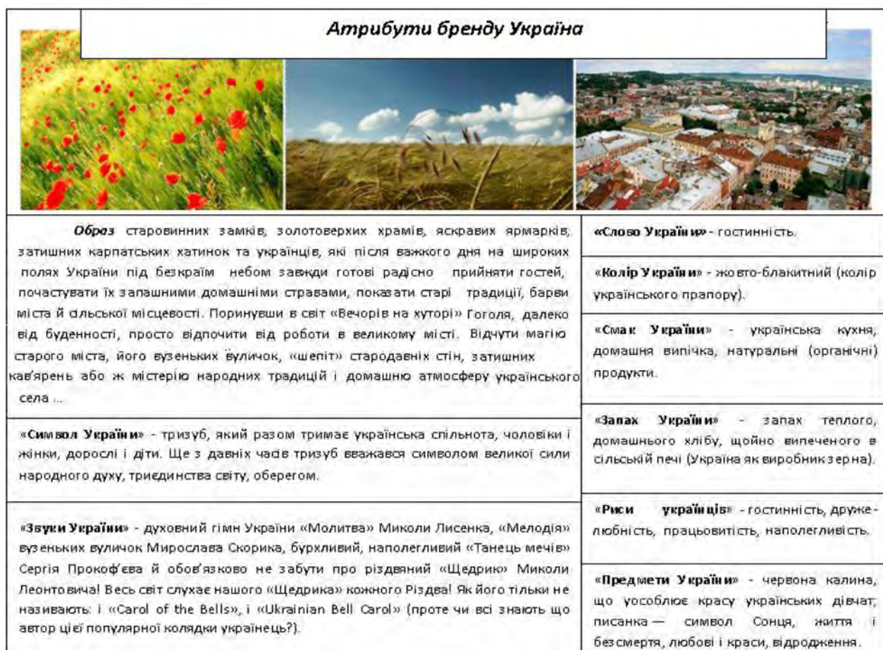
Рис. 2. Пропонований перелік атрибутів бренду України у міжнародному середовищі

Під час формування рейтингів брендів країн опитування проводять насамперед серед звичайних громадян інших країн, туристів, експертів із туризму і національного брендингу та представників міжнародного бізнесу, тому акцент під час пошуку каналів розповсюдження інформації про бренд потрібно робити саме на ці групи людей (рис. 3).