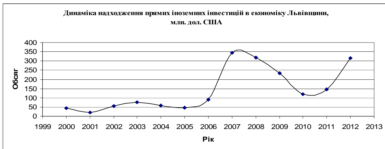
Рис. 3. Іноземні інвестиційні надходження в економіку Львівщини за період 2000–2012 рр.

Як бачимо з даних рис. 3, основний пік залучення інвестицій іноземними інвесторами у Львівську область припадає на 2007 рік і відтоді до 2010 року він спадає. Однак з 2011 року знову спостерігається початок їх зростання, визначальною першопричиною якого виступав проведений в Україні чемпіонат “Євро-2012”.