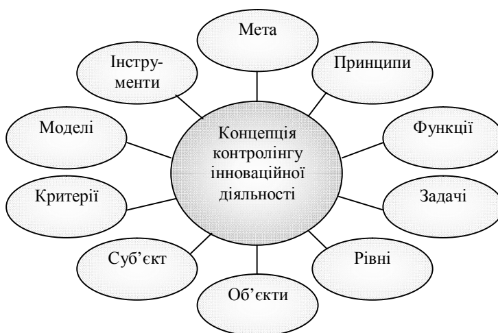
Рис. 2. Загальна схема складових концепції контролінгу інноваційної діяльності

Узагальнюючи думки авторів [6; 8; 10 с. 7], які працювали над досліджуваною проблемою, можна зробити однозначний висновок про те, що автори під час визначення функцій контролінгу інноваційної діяльності не враховували особливостей побудови організаційної структури управління підприємством. Така ситуація спричиняє часткову підміну функцій менеджменту та, як наслідок, появу додаткових бар'єрів на шляху впровадження та ефективного функціонування контролінгового підрозділу. На нашу думку, щоб уникнути цієї проблеми, коло функціональних обов'язків служби контролінгу необхідно