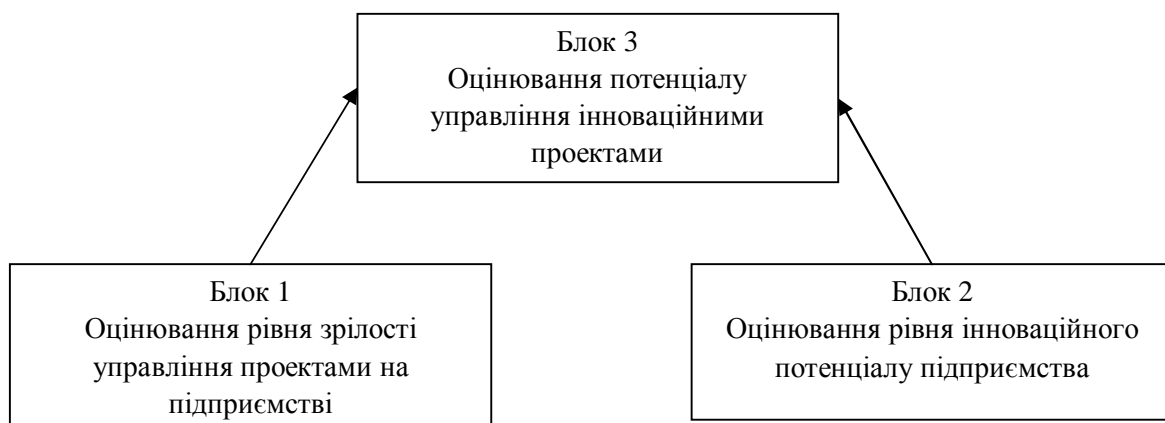
Рис. 1. Схема експрес-методу оцінювання потенціалу управління інноваційними проектами підприємства

Оцінювання рівнів зрілості управління проектами та інноваційного потенціалу підприємства пропонується здійснювати за шкалою від нуля до одиниці. Значення рівня потенціалу управління інноваційними проектами підприємства отримують за допомогою перемноження рівнів блоків 1 та 2. Розроблений метод оцінювання рівня зрілості управління проектами наведено у табл 1.