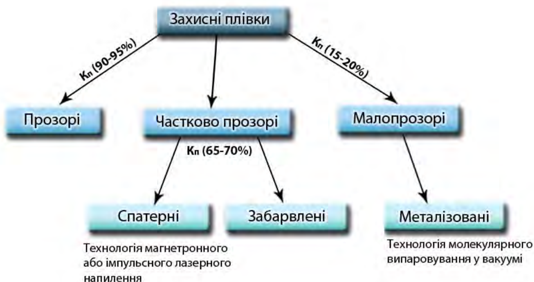
Рис. 2. Класифікація захисних плівок за прозорістю та технологією виготовлення, K_n – коефіцієнт прозорості

зловмисника усередину. В представлену захисну плівку входить полімерна плівка-підкладка та два шари, що здатні блокувати інфрачервоне випромінювання. Бажаною сполукою, що здатна блокувати інфрачервоне випромінювання, є оксид індію та олова, наприклад, \text{In}_2\text{SnO}_3 . Цей матеріал здатний до блокування ІЧ випромінювання у діапазоні від 1400 – 2500 нм, проте, зважаючи на робочі діапазони приладів ЛСАР, можна сказати, що використання цього шару не є ефективним для розв'язання задач, поставлених у цій роботі. До того ж індій – рідкісний метал і має досить високу ціну, яка постійно зростає.