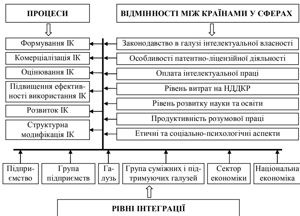
Рис. 4. Диференціація міжнародних факторів впливу на формування і розвиток інтелектуального капіталу (сформовано авторами)

Існують розбіжності у трактуванні інтелектуального капіталу в економічних школах різних країн [15, 16]. Саме міжнародний аспект цієї категорії мало досліджують науковці. Більшість із них у своїх працях зосереджуються на визначенні сутності інтелектуального капіталу, його видів та структури, але не враховують, що будь-яка діяльність підприємств на міжнародному рівні впливає і на його інтелектуальний капітал. На думку О.В. Кендюхова, доцільність аналізу процесів формування та використання знань на груповому, національному та наднаціональному рівнях зумовлена тим, що комбінація різних за кількістю та якістю інтелектуальних капіталів індивідуального рівня створює ефект, який перевищує просту суму названих складових. Фактори впливу на формування і розвиток інтелектуального капіталу диференціюються для окремих процесів, міжнародних факторів впливу та рівнів інтеграції (рис. 4).