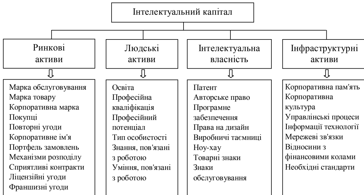
Рис. 3. Структура інтелектуального капіталу за Е. Брукінг

Такий підхід враховує значно більше особливостей міжнародного обміну результатами інтелектуальної діяльності, однак виникає проблема зустрічного трактування термінів «капітал» та «активи». Чи можна вважати що, «людський капітал» за Т. Стюартом тотожний з «людськими активами» за Е. Брукінг? Те саме стосується семантики понять «структурний капітал» – «інфраструктурні активи», «споживчий капітал» – «ринкові активи» тощо.