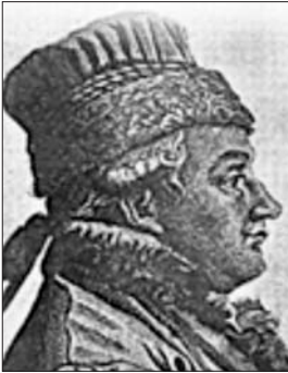
Бальтазар Гакет (Hacquet)

У Львівському університеті (нині — Львівський національний університет ім. І. Франка) географія була предметом викладання від початку його заснування (1661). До цього географію вивчали у