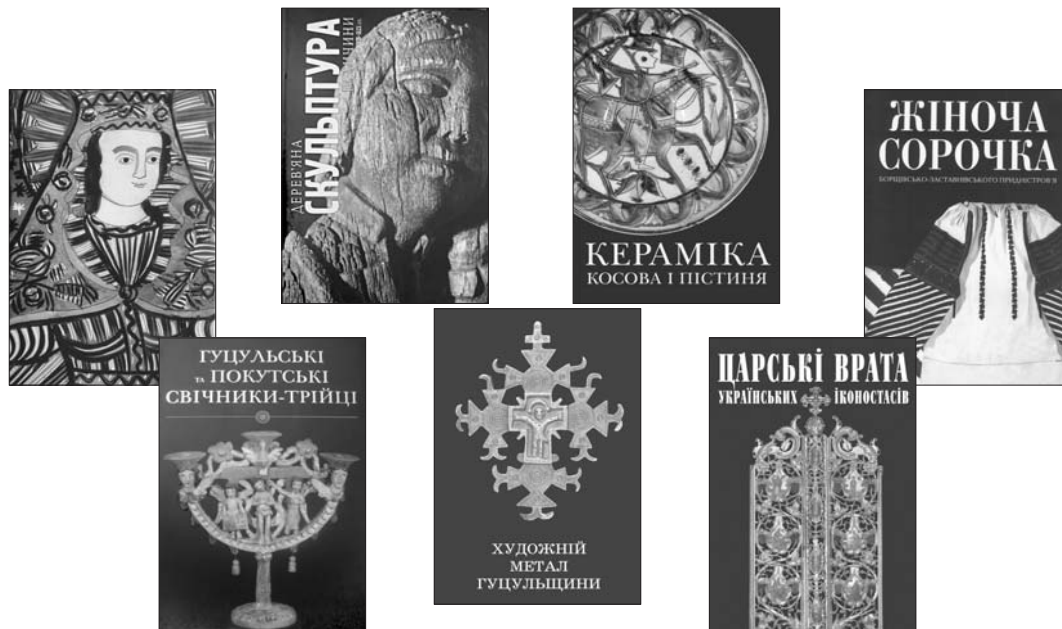
Мистецькі видання серії „Українське народне мистецтво“ (2008—2013) Інституту колекціонерства українських мистецьких пам'яток при Науковому товаристві ім. Шевченка