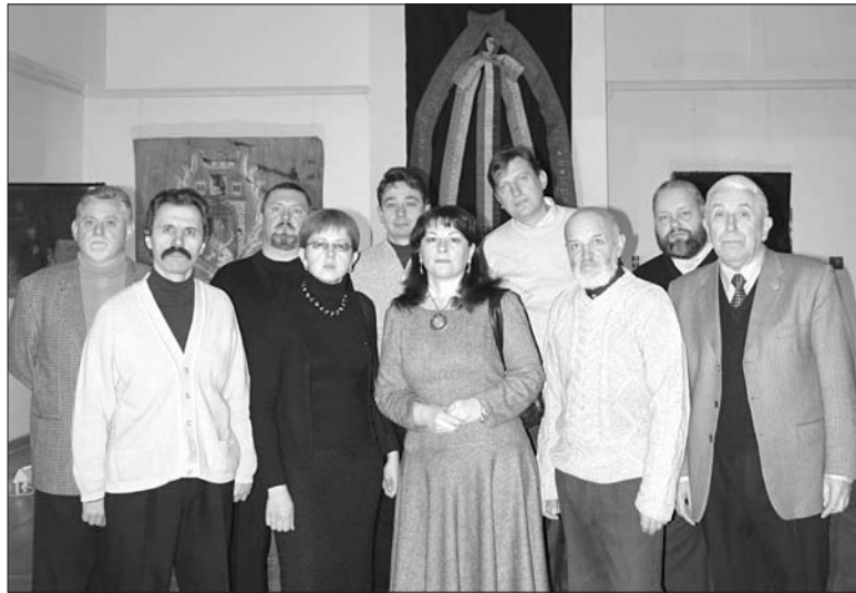
Співробітники Інституту колекціонерства мистецьких пам'яток при Науковому товаристві ім. Шевченка на виставці в Національному музеї ім. А. Шептицького.

з видавництвом „Родовід“), „Іван Труш“, „Маргіта Сельська“, „Олекса Сміх-Шатківський“, „Володимир Патик“, „Леопольд Левицький“ (спільний проєкт з видавництвом „Родовід“), ряд альбомів про Романа Сельського. Започатковано серію мистецьких видань про українських колекціонерів (Іван Гречко) та про твори українського мистецтва з приватних збірок. 2007 р. вийшов друком альбом „Українські січові стрільці. Мистецька спадщина“ (спільний проєкт з НМ