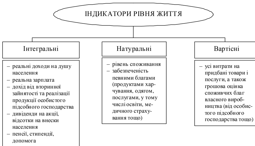
Рис. 2. Індикатори рівня життя [5, с. 17]

Для виміру рівня життя використовують інтегральні, натуральні та вартісні індикатори.