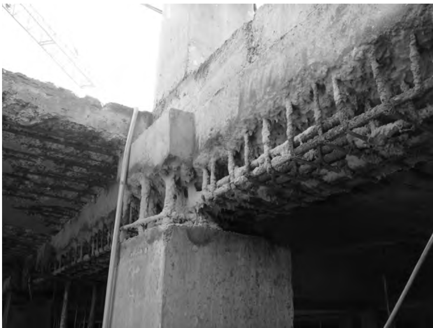
Рис. 3. Замерзлі бетонні, кам'яні та інші конструкції

У разі дотриманні бетону без штучного прогрівання температура основи повинна бути не нижче -10 - -5 °С, а температура бетонної суміші має забезпечувати відсутність замерзання контактного шару. Для цього необхідно застосовувати бетонну суміш позитивної температури (не нижче 15-25 °С) і укладати її шарами інтенсивністю 40 см/год. Укласти бетонну суміш на відігріту основу температурою від -15 до -25 °С можна за умови витримування бетону зі штучним підігріванням і інтенсивністю укладання шарами 30 см/год.