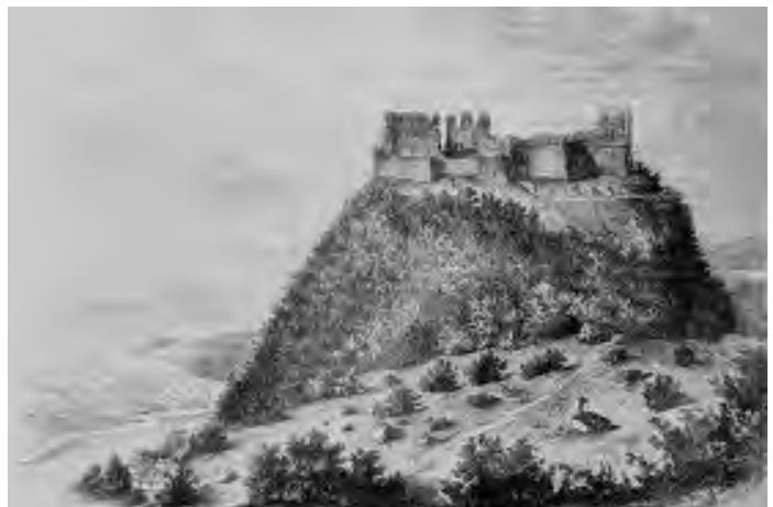
Рис. 2. Топогеодезична карта м. Хуста (2000 р. ) та історичний вид на замкову гору [5]

Історично місто розвивалося на рівнинній території біля підніжжя замку і у 1720 р. у Хусті було 70 дворів. Від середини XVIII ст. і до першої половини XIX ст. місто Хуст зростало, у 1828 р. тут стало вже 377 дворів. З 1760 р. у місті працював пороховий завод, що переробляв селітру з Мараморощини, розвивалося шевське, ткацьке, ковальське ремісництво, а також торгівля великою рогатою худобою, яку переганяли сюди з Галичини і Буковини.