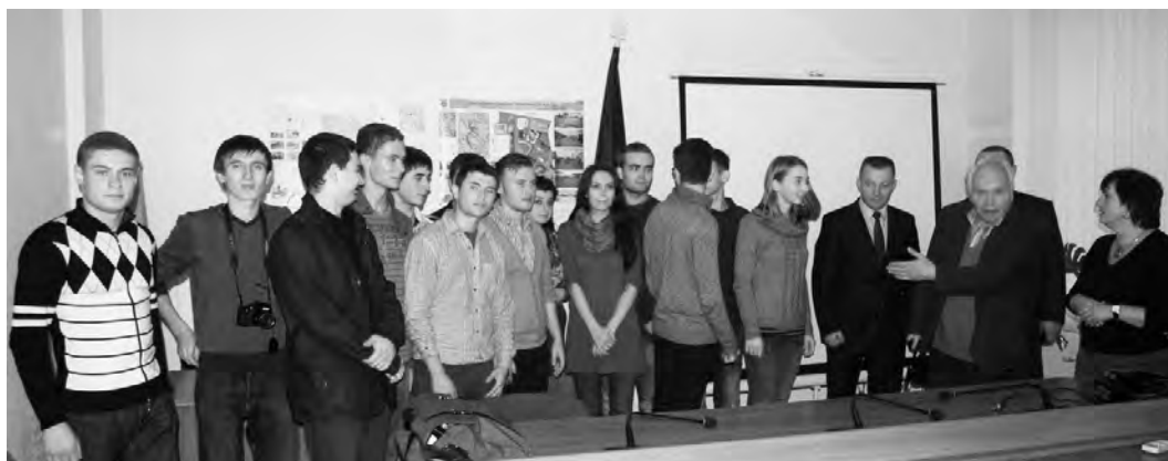
Рис. 1. Презентування проектних концепцій на виконавчому комітеті Хустської міської ради 25.10.2012 р.

Кафедра містобудування в межах курсового проектування з дисципліни “Архітектурне проектування” опрацювала проектні концепції містобудівного розвитку центральної частини м. Хуст Закарпатської області (рис. 1).