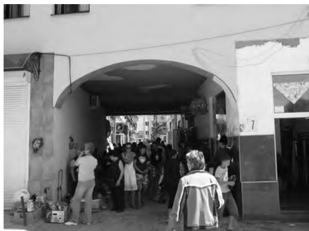
Рис. 5. Простір площі майдану Незалежності та вхід з площі на вул. Репіна

У складі проектних пропозицій щодо реконструкції майдану Незалежності пропонують: змінити функціональне призначення і образ незабудованої ділянки площі спорудженням амфітеатру з розкриттям його на майдан Незалежності; ознакувати колишній історичний контур площі за допомогою виділення фрагментів старих фундаментів у мощенні площі; надати пріоритет пішохідному та автомобільному руху і обмежити транспортний рух, в'їзд на площу передбачити з західної сторони; зберегти традиційну для площі торгову функцію, розташувати торгові заклади у підтрибунному просторі амфітеатру; поєднати простір площі з будівлею на майдані Незалежності, 3, яку згідно з генеральним планом м. Хуста реконструюють під торговий комплекс за допомогою пішохідного містка, доповнити площу елементами облаштування та озеленення, міських меблів, реклами, впорядкування фасадів будинків (рис. 6).