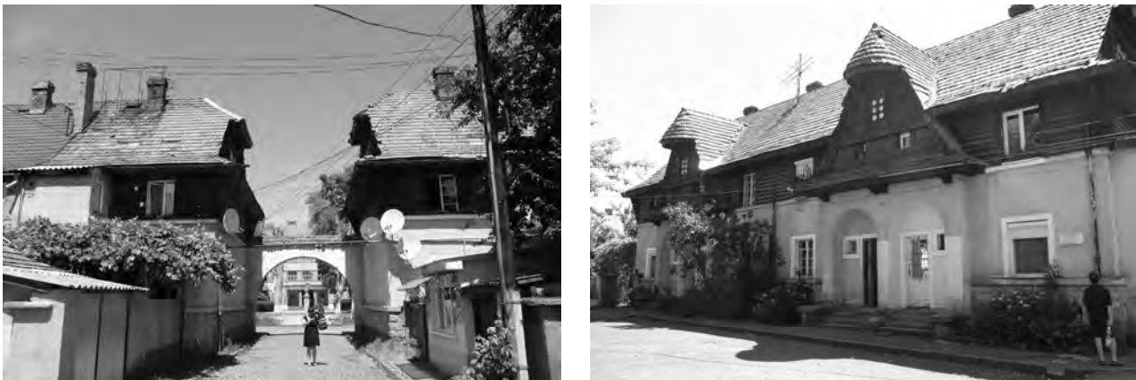
Рис. 3. Вулички “чеського містечка”

Після закінчення Першої світової війни у 1918 р. Хуст зайняли румунські війська, однак у червні 1920 р. місто увійшло до складу Чехословаччини, тоді розпочався “чехословацький період” в історії Хуста, який тривав до листопада 1938 р. За цей час населення міста зросло вдвічі. У 1910 р. у місті проживало близько 10000 осіб, у 1930 – 17883 особи, на початок 1937 р. було близько 20000 мешканців. Статистика за 1930 рік показує національну приналежність населення Хуста: руських (карпаторуських, тобто українців) – 9373, чехів та словаків – 1505, євреїв – 4724, мадярів (угорців) – 1441, німців – 744, румунів – 11, поляків – 6, югославів – 4, циган – 17, інших національностей – 18. На той час місто складалося з невеликих кварталів малоповерхової садибної забудови, у центрі було декілька громадських будинків, побудованих у 20–30-х роках ХХ ст. за проектами чеських архітекторів. Okремо слід сказати про житловий квартал триповерхових будинків, симетрично розташованих навколо школи. У архітектурі будинків майстерно поєднано форми народної архітектури з сучасними на той час функціональними вирішеннями (рис. 3).