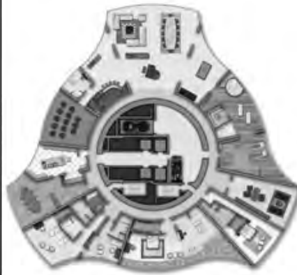
Рис. 7. План типового поверху

Аналіз світового досвіду проектування та спорудження будівель зі змінною геометрією довів, що основні їх типи такі: