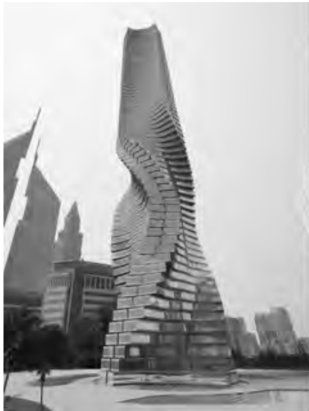
Рис. 6. Вежа Dynamic Tower. Архітектор Девід Фішер