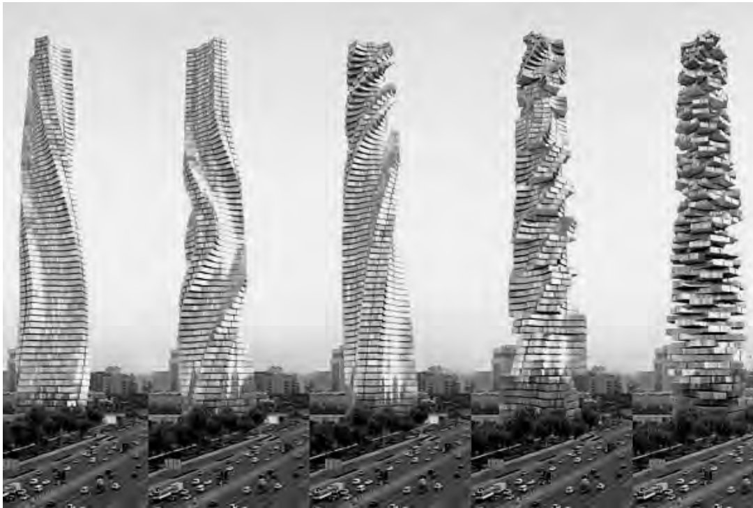
Рис. 8. Проект хмарочоса в Москві. Архітектор Девід Фішер