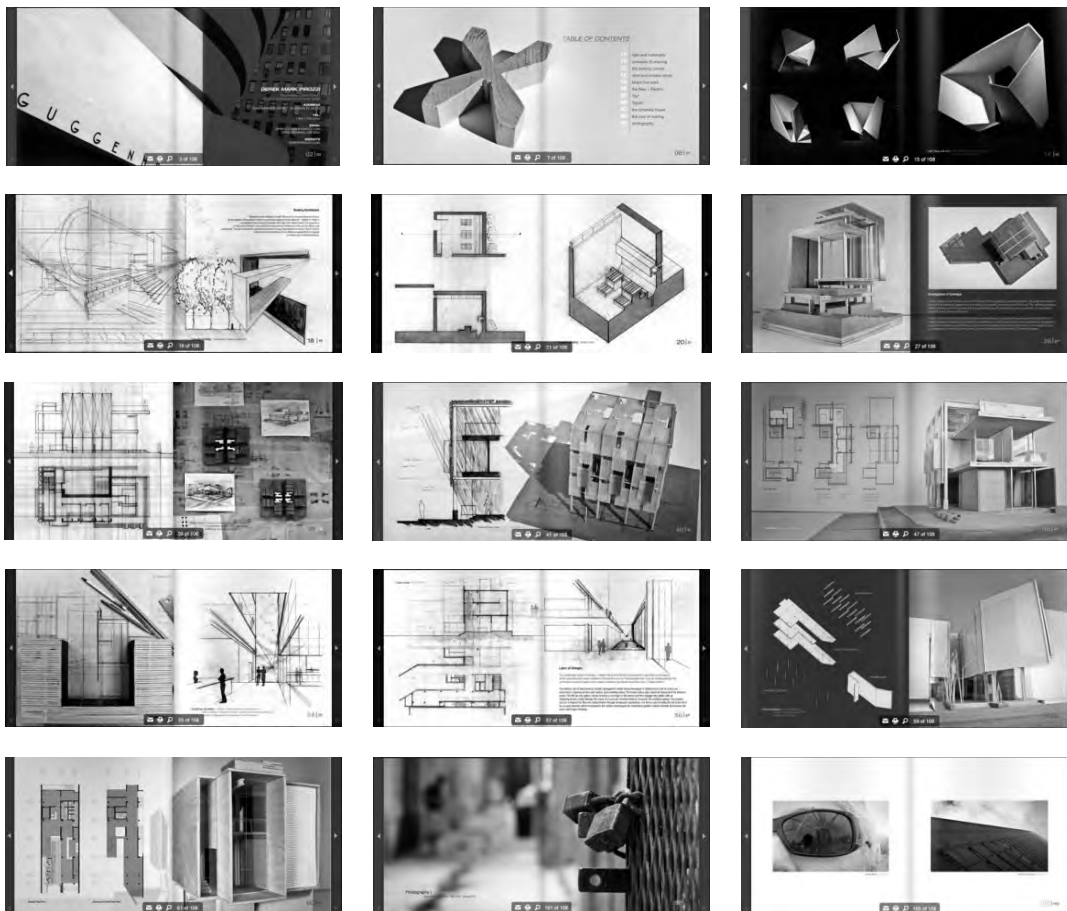
Рис. 2. Приклад портфоліо студента-архітектора (Д.М. Піроци, ун-т Південної Флориди, США)

Найоптимальнішим для архітектурної сфери є останній вид, оскільки саме презентаційне портфоліо надає змогу цілісно відобразити розвиток студента за період навчання. Доречно залучити до розгляду зацікавлених осіб, керівників підрозділів, потенційних роботодавців. Для студента презентаційне портфоліо розв'язує дві задачі: 1) документування процесу і результатів навчання; 2) представлення всього змісту професійної підготовки у власній інтерпретації, у вигляді усвідомлених і засвоєних знань, умінь і навичок.