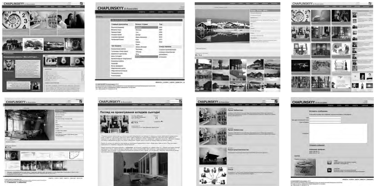
Рис. 1. Приклад сайта-портфоліо архітектурної фірми «Чаплінський і партнери» (Львів)

В умовах взаємопроникнення академічних, суспільних та творчих аспектів професійної підготовки все актуальнішим методом представлення та оцінки навчальних досягнень стає портфоліо студента , яке надає можливість виявляти індивідуальну обдарованість та схильності кожного, простежувати індивідуальний прогрес та визначати подальші творчі перспективи. Створення студентського портфоліо дає змогу отримати об'єктивну зовнішню комплексну оцінку результатів, сприяє розвитку професійних та творчих якостей студента, оцінних та критичних умінь, мотивує поглиблений підхід до навчання.