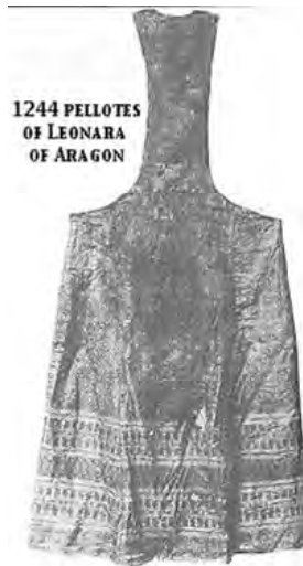
Рис. 4. Сюрко без боків (пелотес) Елеонори Арагонської (XIII ст.)