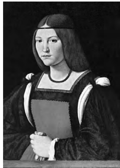
Рис. 5. Портрет молодої жінки Джованні Антоніо Болтраффіо, близько 1490 р., полотно, олія Мілан, Кастелло Сфорцеско

Гримування обличчя було мистецтвом, яким володіла кожна жінка. У волосся вплітали нитки з перлів і коралів, волосся прикрашали спеціальними сіточками і накидками. Всі модні вимоги точно виконувались і кожний італійський портрет епохи Ренесансу є тому підтвердженням.