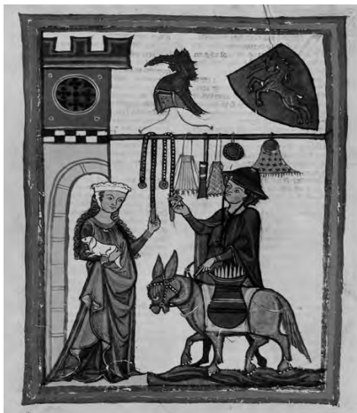
Рис. 2. Сторінка з Манесьського кодексу, на якій зображений дитман фон Аст

убрань одне на одне. Зазвичай це був спідній сорочкоподібний одяг з вузькими рукавами, який називався “каміза”. Поверх камізи вбирали нижню сукню – “котту”, а на неї верхню одягу “блію” подібного крою, але з ширшими рукавами – “духами”, або “сюрко” – сукню без рукавів, що в перекладі з французької означає “поверх котти”. Одяг осіб, які належали до вищих прошарків суспільства, шили з дорогих тканин, краї котрих обробляли декоративною облямівкою. Цю облямівку не тільки вишивали, а й прикрашали золотими пластинками і коштовним камінням. Кольори котти та блію у дворян і міщан мали бути контрастними, а також мати символічне значення [1]. Найяскравіше мода XII–XIII ст. була проілюстрована в книжковій мініатюрі і отримала назву “мода Манесьського кодексу” (рис. 1, 2). 1