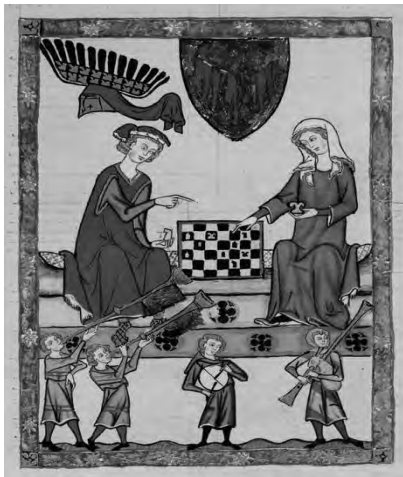
Рис. 1. Сторінка з Манесьського кодексу на якій зображений Маркграф Отто IV фон Бранденбург