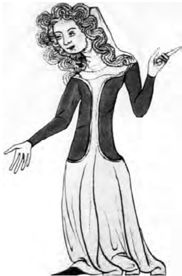
Рис. 3. Молода дівчина. Іл. з Біблії Веліслава, близько 1340 р. Державна бібліотека, Прага

накладного волосся яскраво-жовтого кольору, чим і досягали потрібного ефекту. Італійська світська архітектура Ренесансу враховувала цей момент під час будівництва лоджій у будинках. Передбачались такі зручні місця, де можна було висвітлювати волосся природно – за допомогою сонця. Для цієї цілі жінки використовували спеціальні шляпи, які називали солана (solana), які захищали лице від сонця і одночасно сприяли вибілюванню волосся, яке клали на поля цієї шляпи [4].