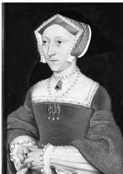
Рис. 8. Портрет Джейн Сеймур, жінка Генриха VIII. Ганс Гольбен Молодший, 1536 р.

ветинську. Звертає на себе увагу в тюдорівській моді головний убір – туре, чеpecь своєрідної форми: п'ятикутний з переду і накладною вуаллю ззаду. Сукні мали характерний крій рукавів з розширеними до низу відкидними крильцями та підставними манжетами до ліктя; з'являються характерні стоячі комірці – рафи (рис. 8). Елизаветинська мода інтерпретує тюдорівський образ плаття: рафи стають вищими, спідниця не просто пишна, а ще і вбрана на кринолін (рис. 9).