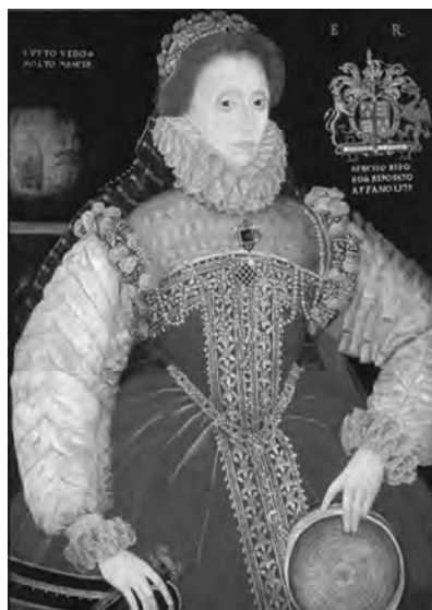
Рис. 9. Портрет Єлизавети з сітом. Джордж Говер, 1579 р.

Франція, яка географічно знаходилася на перетині торговельних шляхів із заходу на схід і з півночі на південь, у свою ренесансну моду долучила елементи з різних костюмів, утворивши зовсім своєрідне плаття (рис. 10).