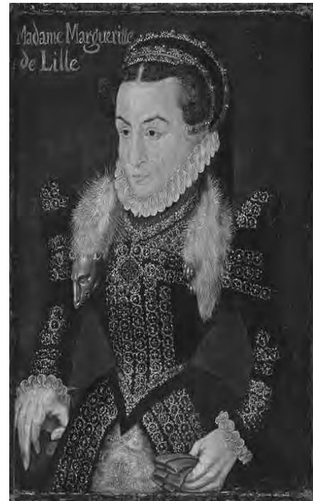
Рис. 10. Маргарита де Лілля

1 – гумовий накат на підошві; 2 – сучасний ватин у амортизуючих прокладках обладунків; 3 – пластикова пахова раковина під час проведення спортивних змагань з певними вимогами безпеки; 4 – синтетичний шнур чи нитки, нержавіючий дріт під час оперативного ремонту спорядження; 5 – використання сучасних антикорозійних і очищувальних засобів, за умов неможливості їх візуальної фіксації; 6 – використання сучасних клеючих і фарбуючих засобів за умови їх прихованого застосування (крім спеціально обумовлених випадків, дозволеного використання стилізованих предметів); 7 – використання сучасних (природних) каліброваних ниток за умови їх прихованого застосування; 8 – застосування спеціальних застілок і супінаторів для взуття, а також бандажів і пов'язок за медичними показаннями. Матеріали, які використані під час відновлення комплексу,