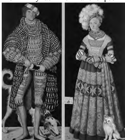
Рис. 7. Портрет герцога Генріха та його дружини. Лукас Кранах Старший. 1514 р.

Історично-музичні фестивалі, які відбуваються сьогодні під стінами замків чи на історично сформованих територіях міст, збирають велику кількість глядачів, також і завдяки відтворенню кожним учасником такого фестивалю історично правильного костюма вибраного періоду. Саме для популяризації культурної спадщини її фізичного збереження та забезпечення повноцінного життя архітектурній спадщині необхідні ґрунтовні наукові дослідження і рекомендації.