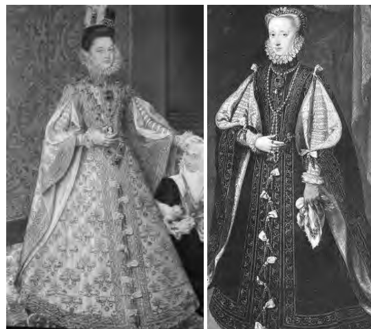
Рис. 6. Портрет Анни Австрійської, четвертої жінки Філіппа II

Англійську ренесансну моду можна умовно поділити на два періоди: тюдорівську та еліза-