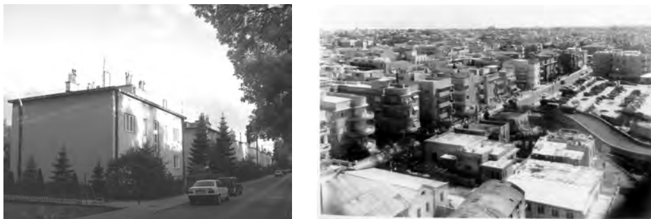
Рис. 3, 4. Стальова Воля (Польща) Рис. 5, 6. Тель-Авів (Ізраїль)

Ці критерії присутні, для прикладу, в забудові функціоналізму наведених вище міст Польщі та Ізраїлю.