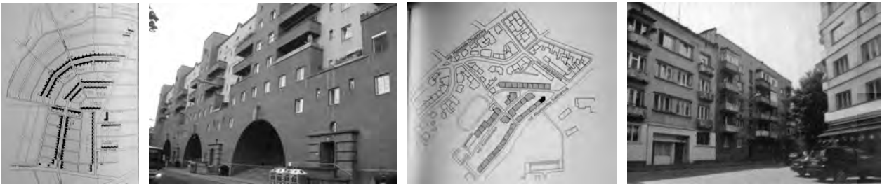
Рис. 1–4. План ансамблевої забудови м. Десау наприкінці 1920-х рр.; Карл-Маркс-Гоф (Відень 1927–1930 рр.) та ансамбль забудови в стилі функціоналізму на вул. Сахарова у Львові [3]