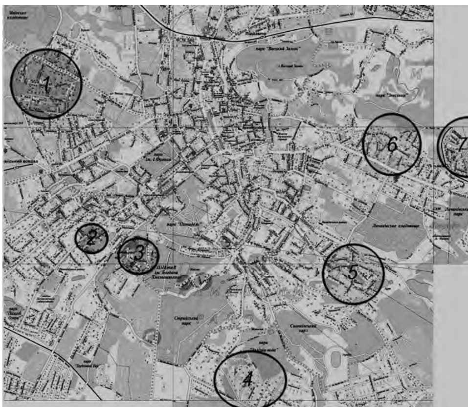
Рис. 7. Мапа із розташуванням ансамблів (осередків) функціоналізму у Львові:

У Львові сучасні архітектурні пам'ятки цього періоду споруджені в своїх кращих виявах ансамблевої забудови в Личаківському, Сихівському, Франківському та ін. районах.