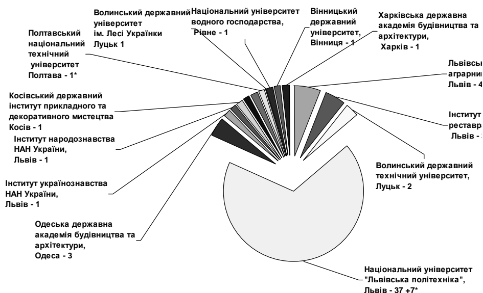
Рис. 2. Вклад спеціалізованої вченої ради К. 35.052.11 у розвиток наукових кадрів установ України упродовж 1998–2012 років:

Всього: за спеціальністю 18.00.01 – Теорія архітектури, реставрація пам'яток архітектури – 56 здобувачів за спеціальністю 18.00.02* – Архітектура будівель та споруд – 8 здобувачів