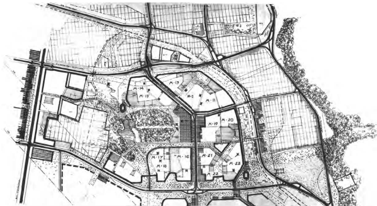
Рис. 1. Техніко-економічне обґрунтування забудови планувального району “Сихів”. М-11 – М-23 – мікрорайони планувального житлового району “Сихів”