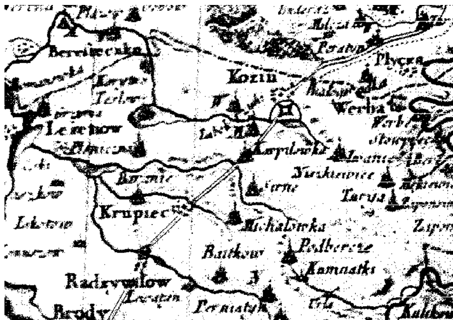
Рис. 2. Фрагмент мапи 1772 р.

Більшість замків були повністю дерев'яно-земляними. Проте протягом XVII – початку XVIII ст. вони нерідко перебудовувались на кам'яні, свідченням чого є замки у Лешневі та Козині. Цьому сприяло, зокрема, розташування їх на поживаєленому торговельному шляху на Дубно (рис. 2).