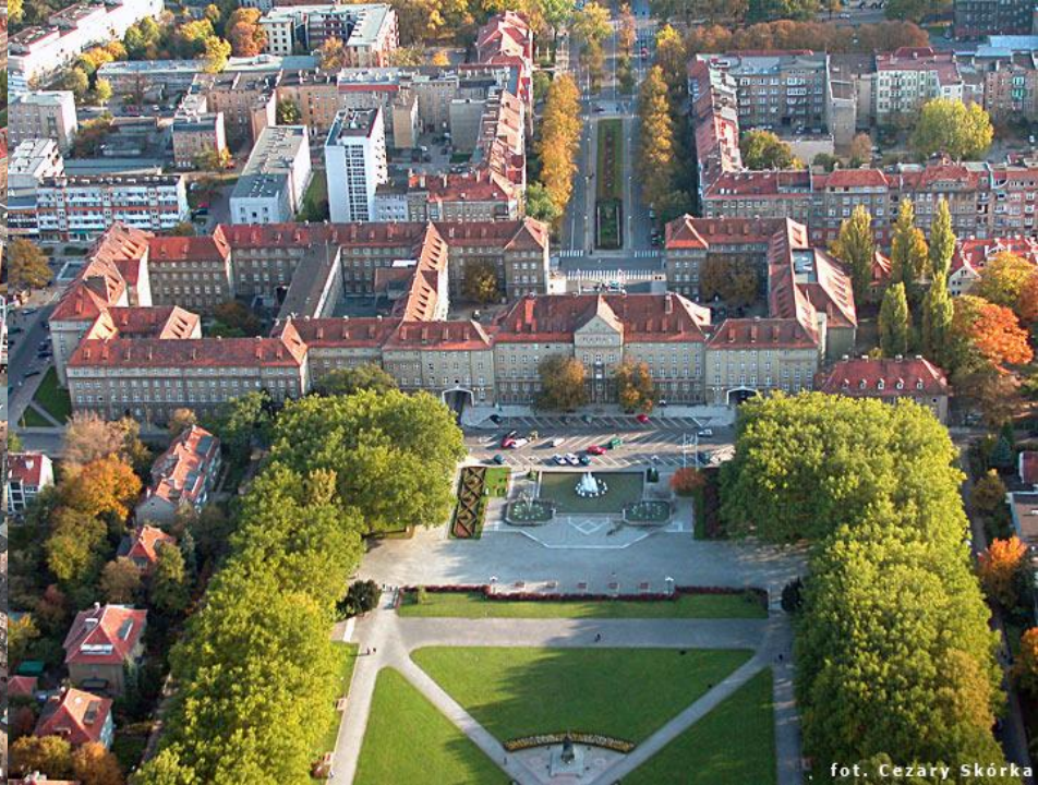
fol. Cezary Skórka