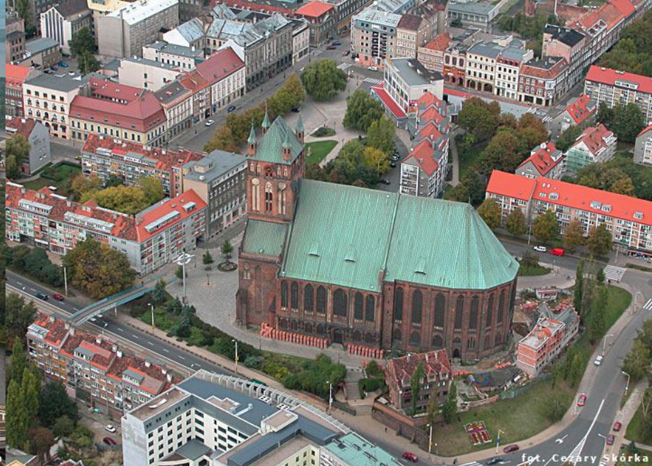
fol. Cezary Skórka