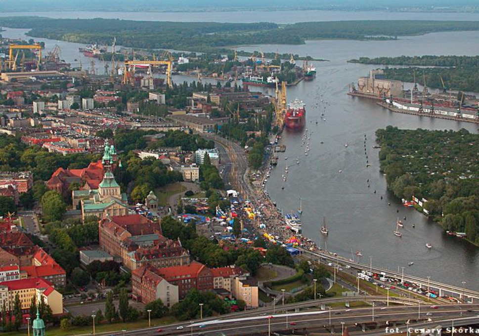
fol. Cezary Skórka