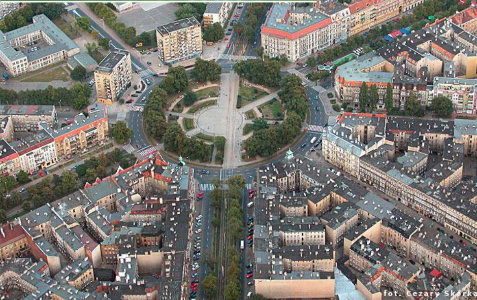
fol. Cezary Skórka