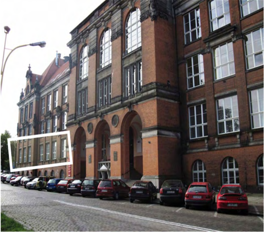
Fot. 1. Stara siedziba Biblioteki Głównej Politechniki Szczecińskiej (zaznaczona ramką)

W 1954 roku powstała w Szczecinie kolejna Uczelnia Wyższa Szkoła Rolnicza, w strukturze której utworzono Bibliotekę Główną. Pierwszą swą siedzibę otrzymała na drugim piętrze w gmachu przy ul. Zygmunta Starego 1, aby wkrótce przenieść się do pomieszczeń na parterze w budynku Rektoratu Uczelni przy ul. Janosika 8, gdzie docelowo zajmowała powierzchnię około 1.000 m 2 .