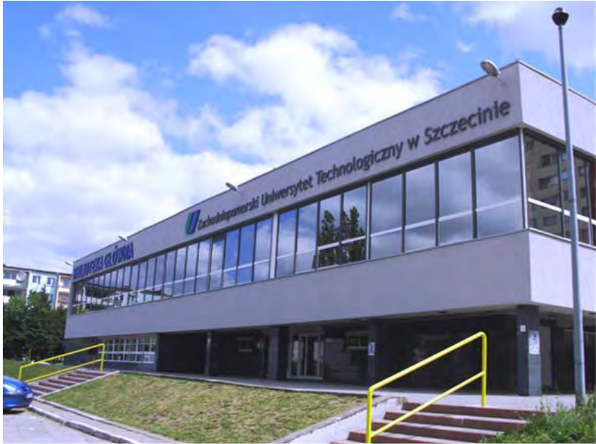
Fot. 3. Nowa siedziba Biblioteki Głównej ZUT w Szczecinie

Główna rozpoczęła funkcjonowanie 1.I.2009 roku. Sytuacja lokalowa Biblioteki Głównej ZUT powstałej z połączenia bibliotek obu Uczelni poprawiła się już w 2012 roku, kiedy to nastąpiło uroczyste otwarcie Biblioteki w nowym gmachu.