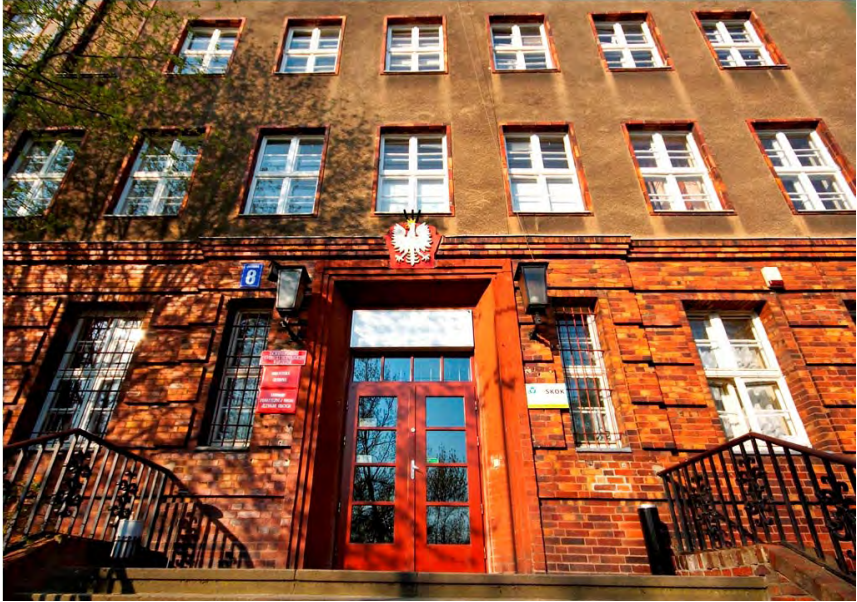
Fot. 2. Stara siedziba Biblioteki Głównej Akademii Rolniczej

Jak widać ze zdjęć, Biblioteki Główne obu uczelni zlokalizowane były w budynkach uczelnianych zupełnie nieprzystosowanych do potrzeb bibliotecznych, bez sprzętu bibliotecznego, bez etatów i bez ustalonego budżetu.