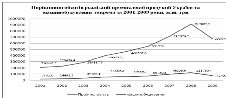
Рис. 1. Порівняння обсягів реалізації промислової продукції України та продукції машинобудування, зокрема за 2001–2009 роки (млн. грн.)

Виробництво машинобудівних підприємств за 2008–2009 роки знизилось. Цьому сприяла світова економічна криза. Наслідки цієї кризи для підприємств проявляються у зростанні боргів, нестачі грошових ресурсів, збільшенні протермінованої кредиторської заборгованості, спаді обсягів продажів. Криза призвела до збільшення кількості фінансово неспроможних підприємств у цій галузі.