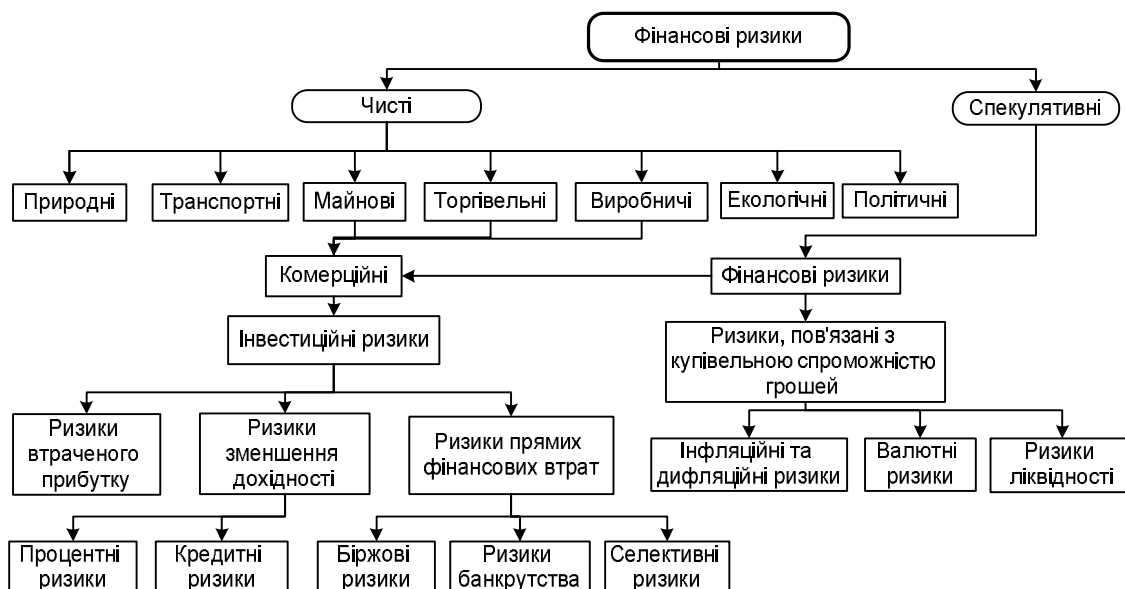
Рис. 2. Класифікація фінансових ризиків

діяльності, а вартісній оцінці вразливості ризику (exposure), яка може бути виражена за допомогою таких показників, як максимальна сума, яку можна втратити в результаті зміни конкретного фактора ризику, середній розмір збитків за певним видом операцій за конкретний період часу, стандартне відхилення прибутків і втрат, максимальний розмір втрат, розрахований з певною ймовірністю їх настання. Очевидно, що вразливість до ризику можна розглядати як функцію від двох параметрів: ймовірності настання негативного явища і масштабу можливих втрат, тобто чутливість портфеля активів організації до наслідків настання цієї події.