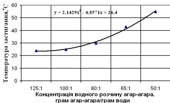
Рис. 2 Залежність температури застигання водного розчину агар-агара від концентрації агар-агара у розчині