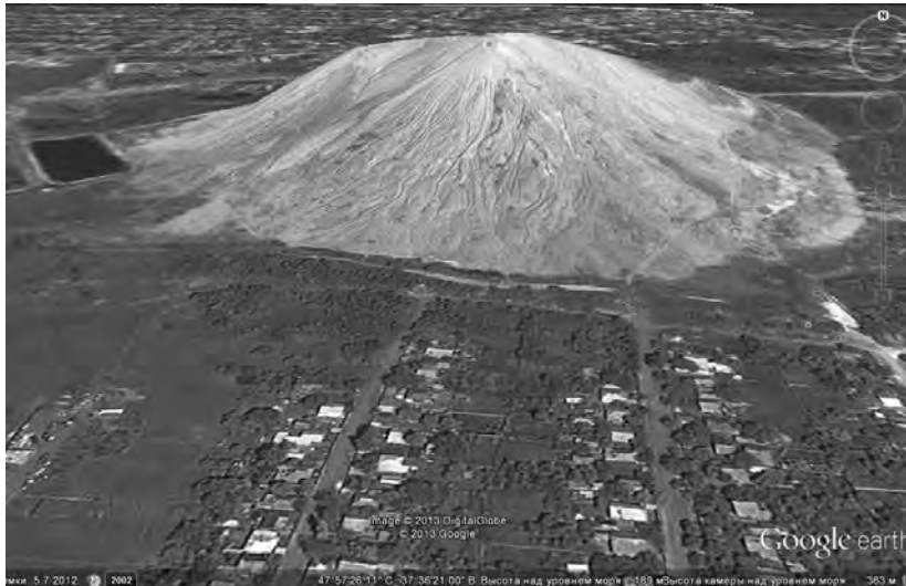
Рис. 2. Космознімок відвалу “Шахта ім. Челюскінців”

Землі, що розташовані поблизу породного відвалу, забруднюються внаслідок повітряної ерозії завислими частками у вигляді пилу. Породні відвали змінюють природний ландшафт та надають йому “гірського” характеру.