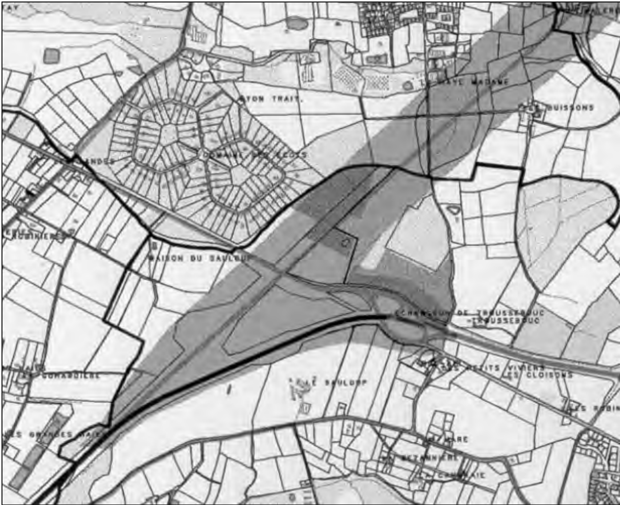
Рис. 1. Локализация новой дорожной сети на фоне местности с земельными участками (IGN France)

Для выбора подходящей трансформации необходимо выполнить не только научный анализ с учетом условий и методов создания, использования и актуализации карт, но также провести много лабораторных тестов и их оценку. Данные оцениваются с точки зрения деформации объектов, т.е. если деформации преимущественно локальные или на всем пространстве 0. Главным средством качественной трансформации является надежное положение идентических пунктов и отстранение пунктов с явным наличием грубых ошибок 0.